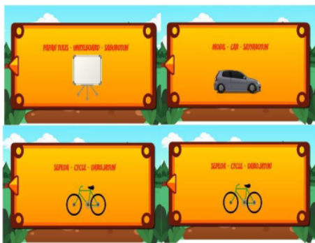
Gambar 2. Proyek OPjBL

Berdasarkan Tabel 4, sig. sebesar 0,000 kurang dari 0,05, yang berarti ada perbedaan (nyata) yang signifikan antara kemampuan pemecahan masalah sebelum diberi perlakuan dan sesudah diberi perlakuan. Proses pembelajaran dengan model OPjBL mahasiswa dapat meningkatkan kemampuan pemecahan masalah multimedia sehingga membentuk mereka untuk menjadi pembelajar yang lebih aktif dan mandiri. Berikut merupakan proyek animasi dasar 2D yang dibuat oleh kelompok mahasiswa.