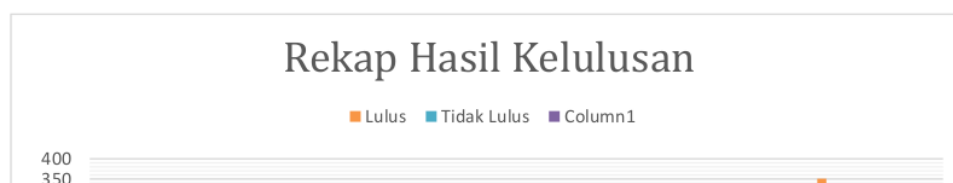
Diagram.1 Tingkat kelulusan PKMU 2016