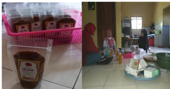
Gambar 3. Kunjungan ke UMKM Sambal Pecel

Dari hasil kunjungan dan wawancara dengan Ketua PCM Tanggulangin (Gambar 1) diketahui bahwa PCM memberikan pembinaan ke UMKM melalui Majelis Ekonomi. Sejauh ini, pembinaan dilakukan melalui berbagai kegiatan misalnya konsultasi, diskusi atau pelatihan untuk berbagai hal yang terkait dengan pengembangan usaha. Dalam wawancara tersebut juga terungkap bila pelaku UMKM binaan PCM Tanggulangin mempunyai motivasi kuat dalam mengembangkan usaha, terutama melalui sertifikasi halal. Dari sisi UMKM, terungkap bahwa pelaku UMKM mempunyai keinginan kuat untuk dapat mengembangkan usahanya dengan melakukan perluasan pangsa pasar. Secara produksi, kemampuan produksi UMKM saat ini dapat ditingkatkan, tetapi terkendala terbatasnya jaringan pemasaran. Saat ini, pemasaran UMKM mengandalkan toko/warung yang ada disekitar wilayah Tanggulangin. Terdapat permintaan dari beberapa konsumen diluar area Tanggulangin dalam jumlah besar dengan syarat adanya logo halal pada produk. Saat ini, permintaan tersebut belum dapat dipenuhi karena pelaku UMKM belum memahami SJH sebagai syarat utama dalam proses sertifikasi halal. Selain itu, pelaku UMKM juga mengalami kesulitan dalam pengisian borangnya. Dalam proses sertifikasi halal, pengisian borang merupakan tahapan yang harus dipenuhi dan memerlukan perhatian khusus oleh pelaku UMKM (Farhan, 2019).