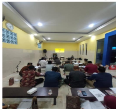
Gambar 6. Pelatihan SJH

Dalam konteks ini, pelatihan difokuskan untuk melatih pelaku UMKM dalam Menyusun SJH. Kegiatan tersebut dilaksanakan pada 17 Nopember 2021 dengan jumlah peserta 20 pelaku UMKM, seperti pada Gambar 6.