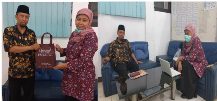
Gambar 1. Kunjungan ke PCM Tanggulangin

Observasi dilakukan dengan melakukan kunjungan dan wawancara pada beberapa pelaku UMKM. Pada kegiatan ini dilakukan kunjungan pada beberapa UMKM dan Ketua PCM Tanggulangin, seperti terlihat pada Gambar 1, Gambar 2 dan Gambar 3.