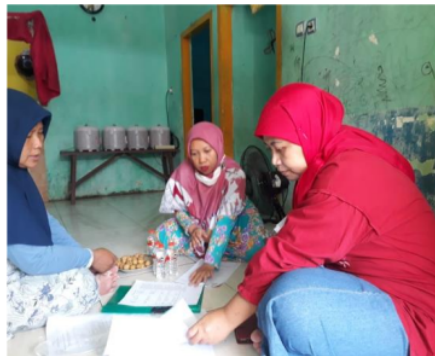
Gambar 2. Kunjungan ke UMKM Makanan Bayi