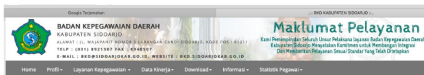
Gambar 2 Maklumat Pelayanan Badan Kepegawaian Kabupaten Sidoarjo