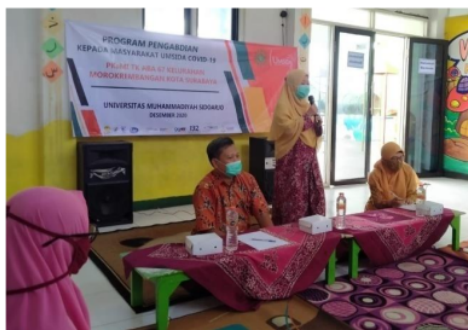
Gambar 4. Penjelasan 6 Langkah Mencuci Tangan oleh Narasumber

Gambar 5. Narasumber dalam penjelasannya menyampaikan bahwa SARS-CoV-2 adalah kelompok baru beta-coronavirus 2b dari subgenus sarbecovirus, subfamili Orthocoronaviridae. Ini memiliki setidaknya 70% kesamaan dalam urutan genetik dengan SARS-CoV. Beberapa virus corona khususnya SARS-CoV dan MERS-CoV merupakan virus zoonosis yang menyebabkan penyakit pernapasan pada manusia. Kelelawar dianggap sebagai vektor karena berbagai penyakit koronavirus termasuk SARS dan MERS terkait dengan itu. Kasus awal SARS-CoV-2 diduga terkait dengan penjualan hewan secara ilegal di pasar seafood basah di Huanan. Belakangan, kasus penularan dari manusia ke manusia dilaporkan dalam skala besar[11].