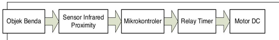
Gambar 2. Blok Diagram Alat Wastafel Cuci Tangan Otomatis

gerakan. Sensor infrared ini bekerja menggunakan prinsip pantulan cahaya infrared sebagai penentu nilainya. Ketika modul sensor mendeteksi sebuah halangan atau object yang ada di depan sensor maka akan diperoleh pantulan cahaya dengan intensitas yang diatur sensitivitasnya dengan sebuah potensiometer. Blok diagram wastafel cuci tangan otomatis ditunjukkan pada Gambar 2.