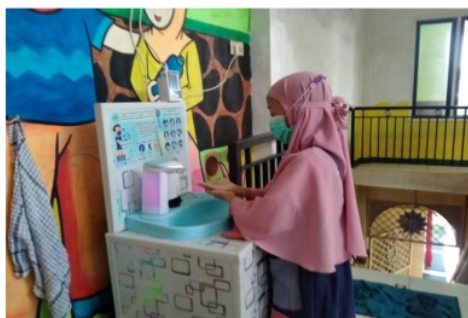
Gambar 5. Praktik 6 Langkah Mencuci Tangan oleh Perwakilan Anak-Anak

COVID-19 dapat menyerang semua kelompok usia. Sebagian besar kasus terjadi pada kelompok usia 30-69 tahun. Hipertensi, diabetes, kardiovaskular, kanker, dan penyakit pemapasan kronis yang sudah ada sebelumnya berisiko komplikasi dengan sedikit dominasi laki-laki. SARS-CoV-2 menyebar melalui tetesan pemapasan. Ini menular jika bersentuhan dengan selaput lendir[12]. Kelangsungan hidup yang tepat di lingkungan tidak diketahui. Meskipun mempertimbangkan karakteristik SARS-CoV dan MERS-CoV, ia dapat bertahan di permukaan selama berjam-jam hingga berhari-hari pada suhu kamar (rata-rata 20 ° C) dan dengan kelembapan tinggi[13]. Ini dapat dibunuh dengan pencucian sabun dan desinfektan seperti alkohol 75%. Masa inkubasinya adalah dua hari hingga 14 hari. Awalnya, pembawa asimtomatik dianggap tidak menular. Kemudian di China, sekelompok kasus dalam sebuah keluarga dilaporkan tertular dari pembawa asimtomatik yang baru-baru ini melakukan perjalanan dari Wuhan. Sejarah perjalanan ke daerah yang terkena dampak seperti China terutama Wuhan, Republik Korea, Italia, Iran, Jepang, Singapura, Prancis, Jerman, Spanyol, Amerika Serikat, Thailand, Inggris, dan sebagainya dalam waktu 14 hari sejak Gejala awal sangat penting untuk mendiagnosis COVID-19[14].