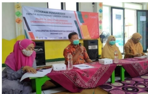
Gambar 3. Penjelasan Kegiatan Pengabdian Masyarakat oleh Ketua Tim Adimas

Kegiatan pengabdian pada masyarakat dilaksanakan oleh Tim Abdimas Prodi Teknik Elektro Fakultas Sains dan Teknologi Universitas Muhammadiyah Sidoarjo, pada tanggal 8 Desember 2020 dengan dihadiri oleh 30 peserta yang terdiri atas tim dosen pengabdian masyarakat, mahasiswa, guru-guru TK, karyawan, perwakilan anak-anak TK ABA 67, dan wali murid siswa. Kegiatan pengabdian masyarakat ini terbagi menjadi tiga tahap, yaitu tahap pertama adalah tahap seremonial, tahap kedua adalah sosialisasi dan demonstrasi penggunaan alat, dan tahap ketiga adalah penyerahan alat wastafel untuk kegiatan guru-guru dan anak-anak ketika proses pembelajaran tatap muka.