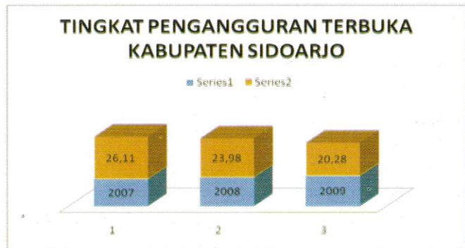
Grafik 4: TPT Sidoarjo

pengangguran yang ada karena membaiknya pertumbuhan perekonomian Kabupaten Sidoarjo sejak tahun 2008 (4,83%) hingga 2010 (5,17%) khususnya di sektor perekonomian sekunder seperti industri pengolahan dan sektor tersier, yaitu perdagangan, hotel, restoran (6,52%) serta angkutan dan komunikasi sebesar 9,63%. Dari kedua sektor itulah tenaga kerja di usia produktif banyak terserap.