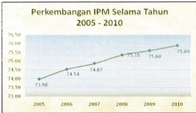
Grafik 1: Perkembangan IPM Sidoarjo