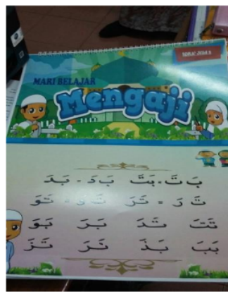
Gambar 2. Salah satu halaman pada alat peraga lembar balik Iqra jilid 2