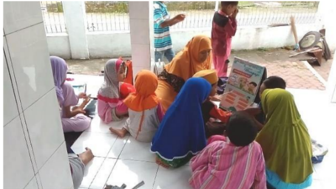
Gambar 3. Salah satu pendidik menggunakan alat peraga lembar balik Iqra' dalam pembelajaran

Berdasarkan hasil pelaksanaan program pengabdian kepada masyarakat ditemukan beberapa hal yang berhubungan dengan pemanfaatan media pembelajaran yang telah dirancang oleh tim pelaksana PKM yaitu: