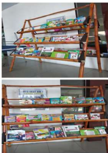
Gambar 2. Taman baca Desa Grogol

Sementara taman baca desa Grogol yang terletak di balai desa Grogol kecamatan Tulangan merupakan taman baca yang belum dikelola dengan baik, hal ini bisa dilihat dari sistem penempatan dan banyaknya koleksi buku yang ada, selain belum adanya petugas yang diberikan tugas khusus untuk mengelola taman baca tersebut, sehingga memberikan kesan bahwa taman baca desa tersebut bukanlah taman baca yang sewajarnya. Sementara di lingkungan balai desa terdapat sekolah Taman Kanak-kanak (TK), sehingga taman baca ini memberikan pesan yang sangat penting sebagai tempat kegiatan yang dapat menstimulus bagi anak usia dini untuk menyukai membaca dan dengan membangun gerakan budaya gemar membaca.