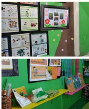
Gambar 1. Taman baca desa Kenongo

Sementara taman baca desa Grogol yang terletak di balai desa Grogol kecamatan Tulangan merupakan taman baca yang belum dikelola dengan baik, hal ini bisa dilihat dari sistem penempatan dan banyaknya koleksi buku yang ada, selain belum adanya petugas yang diberikan tugas khusus untuk mengelola taman baca tersebut, sehingga memberikan kesan bahwa taman baca desa tersebut bukanlah taman baca yang sewajarnya. Sementara di lingkungan balai desa terdapat sekolah Taman Kanak-kanak (TK), sehingga taman baca ini memberikan pesan yang sangat penting sebagai tempat kegiatan yang dapat menstimulus bagi anak usia dini untuk menyukai membaca dan dengan membangun gerakan budaya gemar membaca.