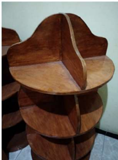
Gambar 6. Rak buku inovatif

Proses pembuatan dilakukan dengan memperhatikan tingkat kesulitan dan bahan yang dibutuhkan sehingga dalam pembuatan dilakukan oleh pihak ketiga, sementara desain dan ukurannya berdasarkan gambar yang telah dibuat. Berikut hasil akhir rak buku inovatif yang telah dibuat.