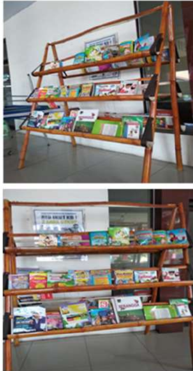
Gambar 4. Rak buku pada taman baca desa Grogol (Mitra 2)