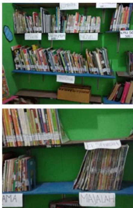
Gambar 3. Rak buku di Taman baca desa kenongo (Mitra 1)

Berdasarkan uraian pada analisis situasi tersebut, maka permasalahan utama mitra adalah pada mitra 1 yaitu taman baca Flamboyan adalah kurangnya ketersediaan buku yang sesuai dengan tumbuh kembang anak usia dini sehingga selama ini buku yang tersedia hanya untuk usia dewasa dan remaja. Berikutnya adalah rak buku yang kurang memadai karena ada sisi rak yang sudah tidak mampu menopang buku-buku yang ada, terakhir adalah sistem pengelolaan perpustakaan yang kurang baik.