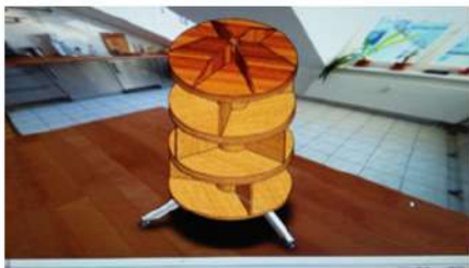
Gambar 5. Desain Rak buku Inovatif

Maka dengan pertimbangan tersebut desain rak dibuat sebagaimana gambar tersebut dibawah ini.