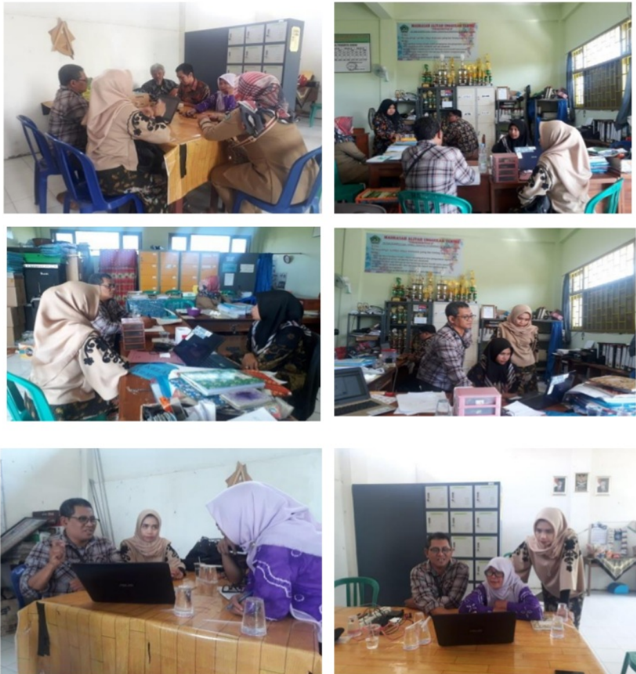
Gambar 3. Proses Sosialisasi Aplikasi