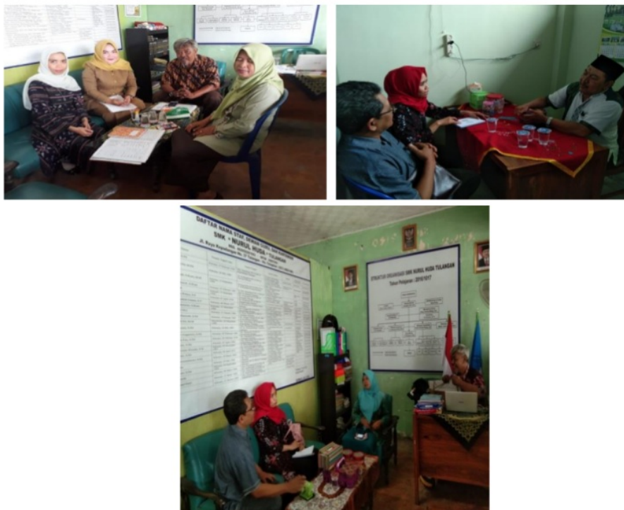
Gambar 1. Proses Observasi dan Wawancara

Kegiatan pengabdian masyarakat ini diawali dengan persiapan pelaksanaan kegiatan, yaitu diantaranya observasi langsung terhadap objek, wawancara dengan objek dalam hal ini Bendahara SMK Nurul Huda dan MA Unggulan Tlasi. Observasi dilakukan dengan melihat keadaan obyek dan mewawancarai apa yang menjadi kelemahan di SMK Nurul Huda dan MA Unggulan Tlasi.