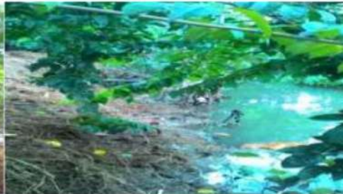
Gambar 5 : Lokasi Pembuangan 2 limbah Kotoran

Permasalahan mitra 2 adalah belum adanya penerapan teknologi pakan pada ternak sapi, dan masih bertumpu pada rumput. Hal ini disebabkan karena keberadaan hewan ternak pada kelompok peternak sapi pada mitra 2 bertujuan untuk proses penggemukan yang di persiapan untuk memenuhi kebutuhan kegiatan keagamaan yaitu lebaran Haji. Dengan hanya bertumpu pada satu jenis pakan, diyakini kegiatan kelompok Peternak sapi akan mengalami kesulitan dalam upaya untuk melakukan penggemukan, sehingga harus di lakukan perbaikan dan inovasi penerapan alternatif pakan, sehingga mampu memberikan nilai positif pada pengolahan bahan- bahan alternatif pada pemberian pakan ternak tersebut (Kottler, 2007)