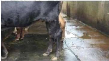
Gambar 2 : Kondisi Kandang mitra 2

Mitra 2 adalah kelompok Peternak sapi, yang berlokasi desa Gangang Panjang, merupakan kelompok Peternak yang memiliki bangunan kandang yang lebih baik, dengan konsep sanitasi yang lebih maju. Kemudian secara umum anggota kelompok merupakan pemilik langsung dari hewan ternak yang di beli dari uang sendiri dan bukan hasil bantuan sosial dari pemerintah atau lembaga lain, dari segi ekonomi anggota kelompok masih lebih baik karena keberadaan hewan sapi yang dimiliki bukan satu-satunya penghasilan utama, karena kebanyakan dari anggota telah memiliki pekerjaan tetap. Pertimbangan dari adanya kelompok peternak ini adalah bertujuan untuk penggemukan hewan ternak sapi guna mempersiapkan banyaknya kebutuhan akan hewan ternak terutama sapi pada kegiatan keagamaan Islam yang tersebut.