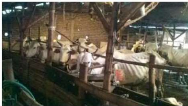
Gambar 1 : Kondisi sanitasi Kandang mitra 1

Mitra 1 yaitu kelompok peternak sapi ‘Lembu Joyo’, merupakan kelompok yang terdiri dari beberapa orang anggota yang secara bersamaan memperoleh program baksos berupa hewan ternak berupa sapi, yang selanjutnya mereka membuat kelompok ternak secara sukarela dan menempatkan hewan ternaknya di suatu tempat yang terpusat, sehingga masing-masing anggota memiliki kewajiban yang sama atas kepemilikan sapi-sapi tersebut.