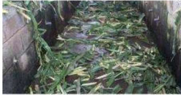
Gambar 11. Limbah bahan pakan yang tidak terpakai