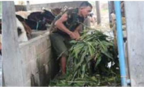
Gambar 8. Pemberian pakan berupa daun jagung

Permasalahan berikutnya adalah belum adanya alat yang dapat mempermudah kinerja kelompok dalam memotong bahan pakan yang diperoleh baik berupa tanaman jagung atau bahan pakan lain. Sehingga kinerja pemberian pakan yang dilakukan oleh kelompok kurang efektif.