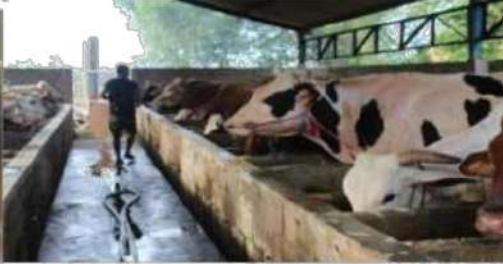
Gambar 3 . Kondisi Sanitasi kandang mitra 2

Permasalahan Mitra 1 adalah Limbah kotoran yang dihasilkan oleh ternak sapi pada kelompok peternak sangat melimpah, dan tidak ada nilai ekonomis yang dihasilkan dari kotoran tersebut dan Keterbatasan kemampuan pada kelompok peternak sapi dalam mengelola usaha pengolahan pupuk kandang dalam hal manajemen usaha, manajemen pemasaran, dan keuangan