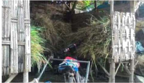
Gambar 6 : Rumput sebagai pakan Utama

Alternatif perolehan bahan pakan yang variatif tersebut dengan cara memberikan jenis pakan berupa sentrad atau dedak dan tanaman jagung serta bahan-bahan pakan lain.