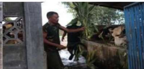
Gambar 10. Pemotongan pakan jagung secara manual