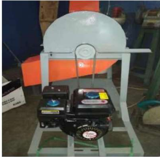
Gambar 5.5 mesin pencacah pakan ternak