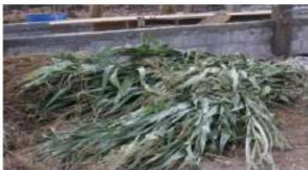
Gambar 9. Bahan pakan tanaman jagung manual

Permasalahan berikutnya adalah belum adanya alat yang dapat mempermudah kinerja kelompok dalam memotong bahan pakan yang diperoleh baik berupa tanaman jagung atau bahan pakan lain. Sehingga kinerja pemberian pakan yang dilakukan oleh kelompok kurang efektif.