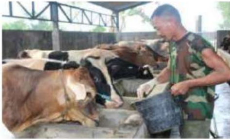
Gambar 7. Pemberian pakan sentrat

Alternatif perolehan bahan pakan yang variatif tersebut dengan cara memberikan jenis pakan berupa sentrad atau dedak dan tanaman jagung serta bahan-bahan pakan lain.