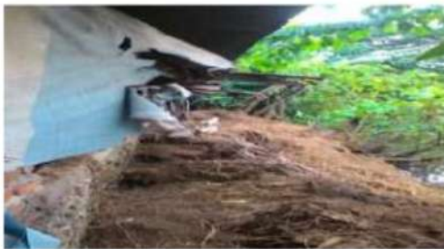
Gambar 4 : Lokasi pembuangan 1 limbah Kotoran

Permasalahan Mitra 1 adalah Limbah kotoran yang dihasilkan oleh ternak sapi pada kelompok peternak sangat melimpah, dan tidak ada nilai ekonomis yang dihasilkan dari kotoran tersebut dan Keterbatasan kemampuan pada kelompok peternak sapi dalam mengelola usaha pengolahan pupuk kandang dalam hal manajemen usaha, manajemen pemasaran, dan keuangan