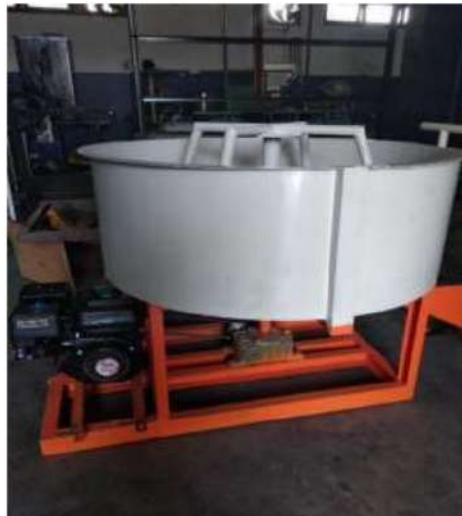
Gambar 5.4 Mesin Pengaduk Pupuk Kandang

Pembuatan alat pengaduk pupuk kandang ini, didasari dari aktivitas kelompok ternak atas ketidak tahuan pemanfaatan kotoran yang dihasilkan oleh ternak kelompok mitra. Sehingga dengan pembuatan alat ini nantinya akan memberikan nilai ekonomis yang dapat memberikan nilai tambah bagi anggota kelompok. sehingga selain pemanfaatan limbah kotoran juga akan ada pola perubahan perilaku anggota atas perlakuan hasil limbah kotoran ternak yang dimiliki oleh kelompok mitra.