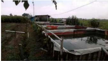
Gambar 2. Kondisi kolam lele

Penempatan lele pada kolam-kolam yang terbuat dari terpal bekas yang diperoleh dari pengepul di Mojokerto, diyakini biaya pembuatan yang lebih murah dibandingkan dengan kolam ikan yang selama ini di buat oleh masyarakat. Dilain sisi dengan adanya produksi lele tersebut akan memberikan kemudahan bagi pelaku usaha yang bergerak dibidang penjualan makanan untuk memperoleh ikan lele yang merupakan bahan utama mereka.