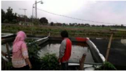
Gambar 1. Kolam lele siap Panen