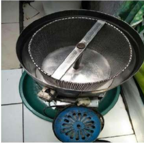
Gambar 6. Kondisi Alat pengering Abon

dimiliki sehingga dimungkinkan jika terjadi kerusakan akan mengganggu aktivitas pengolahan.