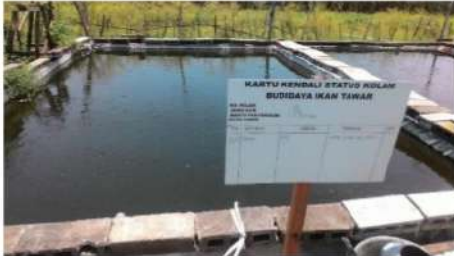
Gambar 7. Papan nama kendali status kolam

Karena digunakan sebagai bahan evaluasi maka papan nama tersebut dibuat dengan format yang disesuaikan dengan kebutuhan yang dimiliki oleh mitra, hal ini bertujuan agar fungsi kontrol atas budidaya ikan lele tersebut akan memberikan dampak positif atas pertumbuhan dan perkembangan budidaya tersebut.