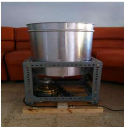
Gambar 8. Alat pengering abon Lele

Melakukan pengolahan ikan lele menjadi produk olahan Abon, memiliki kendala atas kondisi alat yang digunakan untuk melakukan pengeringan hal ini disebabkan karena tidak adanya alat alternatif yang dimiliki selain alat yang saat ini dimiliki sehingga dimungkinkan jika terjadi kerusakan akan mengganggu aktivitas pengolahan. Sehingga dengan adanya bantuan pembuatan alat tersebut memungkinkan mitra mampu meningkatkan produktivitas produksi lebih baik.