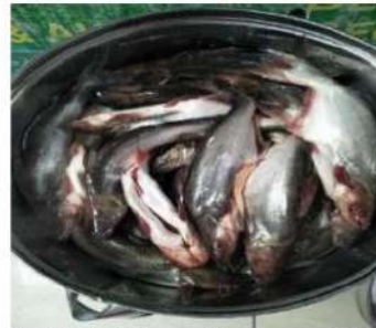
Gambar 3. Tahapan Proses pengolahan