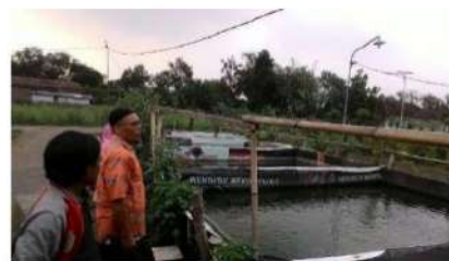
Gambar 5. Penjelasan atas kondisi kolam oleh Pemilik

Kondisi kolam yang tersebut pada gambar 1 dan 2, menunjukkan bahwa sistem pengelolaannya yang dilakukan oleh mitra 1 kurang baik, hal ini dapat dilihat dari tidak adanya identitas atas kolam ikan tersebut sehingga bagi kaum awam yang ingin mengetahui umur ikan dan informasi lainnya tidak dapat mengetahui.