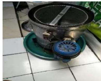
Gambar 4. Alat pengering Abon