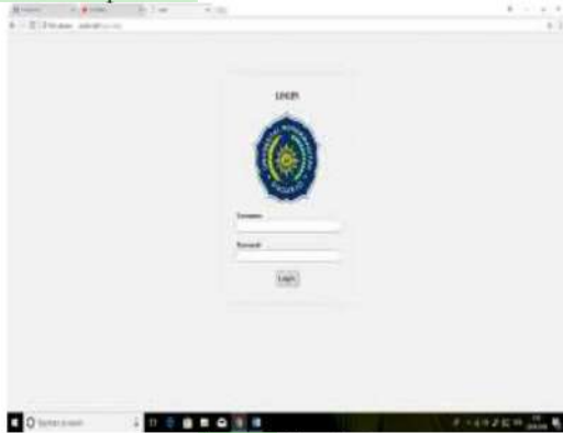
Gambar 1. Menu login

Halaman home admin adalah halaman yang 5 menampilkan informasi dan untuk masuk system harus memasukkan username dan password