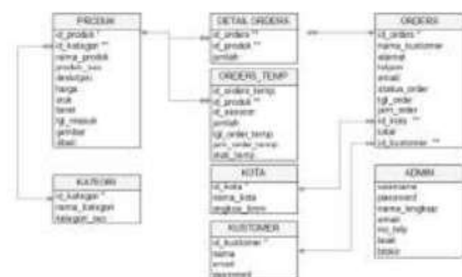
Gmb 3. Korelasi Tabel

Hubungan antar tabel yang mempresentasikan hubungan antar objek di dunia nyata yang merupakan hubungan yang terjadi pada satu tabel dengan lainnya dan berfungsi untuk mengatur oprasi untuk database. Yang mencerminkan sifat dari objek tersebut serta memiliki makna element data dan kolom item