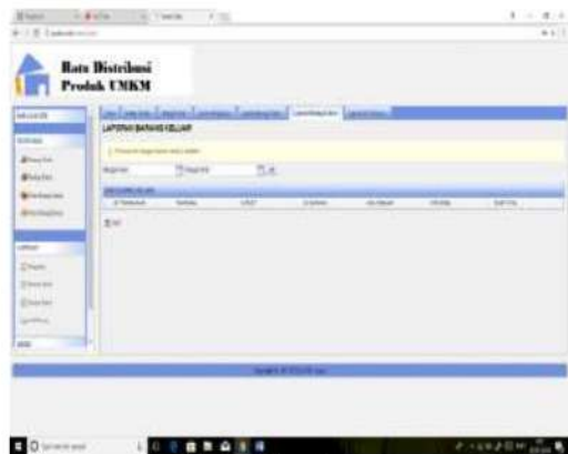
Gambar 2. Tampilan menu

5 Halaman menu Utama adalah halaman yang menampilkan informasi keseluruhan fasilitas yang ada pada sistem