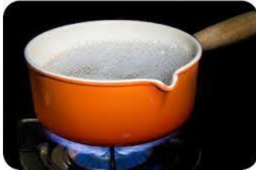
Gambar 1.4 Contoh peristiwa konveksi

3. Radiasi adalah perpindahan kalor tanpa memerlukan zat perantara. Contoh konveksi adalah tubuh terasa hangat ketika dekat dengan api unggun yang sedang menyala, perpindahan panas dari cahaya matahari ke bumi , lampu pijar listrik yang sedang menyala.