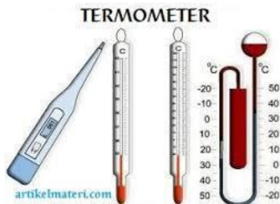
Gambar 1.1 Contoh Alat pengukur suhu

Suhu adalah suatu besaran yang menyatakan ukuran derajat panas atau dinginnya suatu benda. Untuk mengetahui dengan pasti dingin atau panasnya suatu benda, kita memerlukan suatu besaran yang dapat diukur dengan alat ukur. Alat untuk pengukur suhu disebut Termometer.