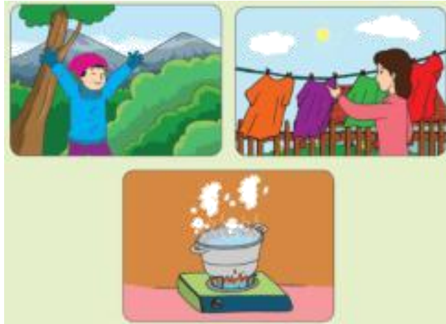
Gambar 1.2 Contoh perpindahan kalor

1. Konduksi adalah proses perpindahan kalor tanpa disertai perpindahan bagian-bagian zat itu. Konduksi umumnya terjadi pada benda padat. Dalam konduksi yang berpindah hanyalah energi saja yaitu berupa panas. Contohnya saat kita mengaduk air teh panas dengan sendok, maka lama kelamaan tangan kita terasa panas dari ujung sendok yang kita pegang. Contoh lainnya ketika kita memanaskan batang besi di atas nyala api, maka kalor/panas akan berpindah dari ujung besi yang dibakar ke ujung besi lain.