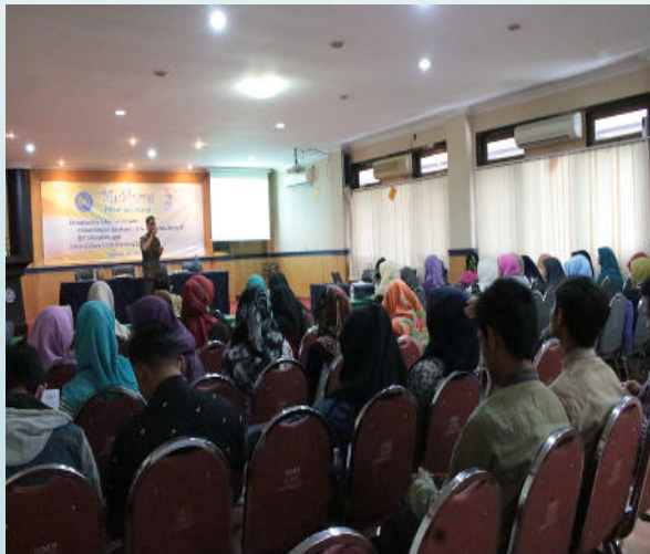
MeShare (Meet and Share) tentang CCU