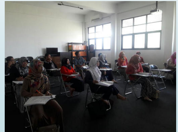
TOEFL PREPARATION DOSEN