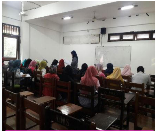
TOEFL PREPARATION MAHASISWA