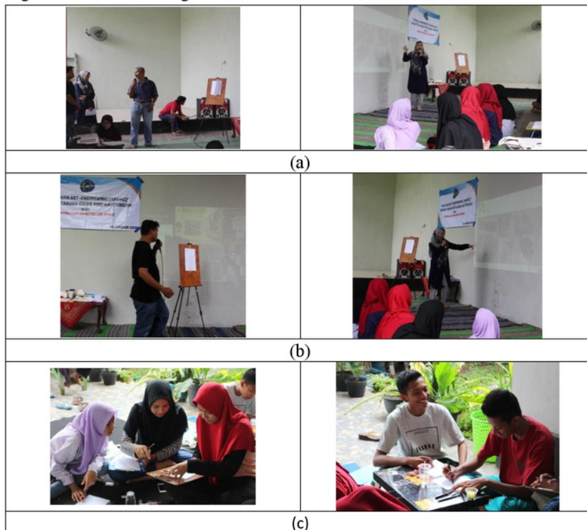
Gambar 3. Proses pelaksanaan kegiatan (a) pembukaan, (b) pemberian materi, (c) praktik langsung

Keseluruhan kegiatan disusun sedemikian rupa sehingga peserta dapat menikmati setiap prosesnya dengan baik dan terarah. Akan tetapi dengan adanya keterbatasan waktu sehingga tidak semua materi disampaikan dengan detail dan hanya praktek langsung seni yang dapat dilakukan sedangkan pembuatan alat sederhana hanya ditunjukkan melalui video, berikut dokumentasi acara pelatihan dapat dilihat pada Gambar 3.