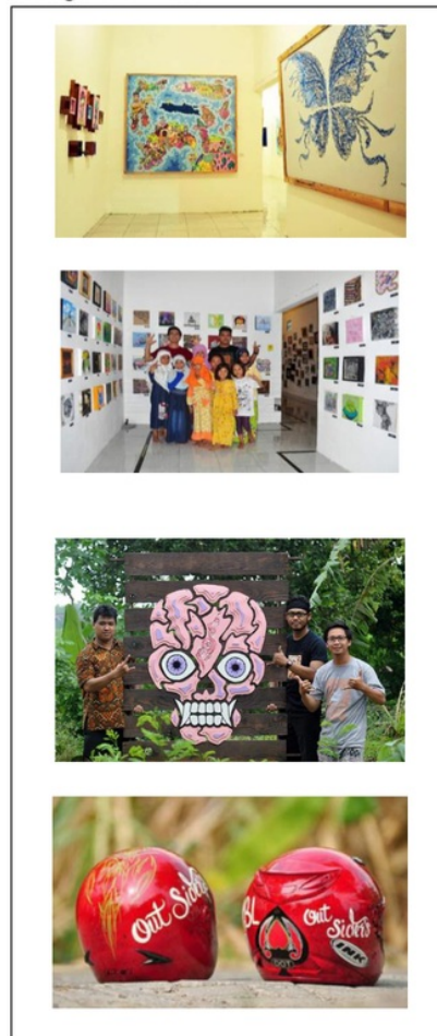
Gambar 1. Hasil Karya Pawitra Art Space

minimnya minat seni pada kalangan remaja. Meskipun dapat dibilang masih seumur jagung akan tetapi dengan segala keterbatasannya Pawitra Art Space telah aktif mengadakan art exhibition , dimana salah satunya bertempat di Artotel Surabaya pada maret 2017. Berlokasi di desa tidak menyurutkan Pawitra untuk berkarya, beberapa contoh hasil karya dapat dilihat pada Gambar 1 sebagai berikut.