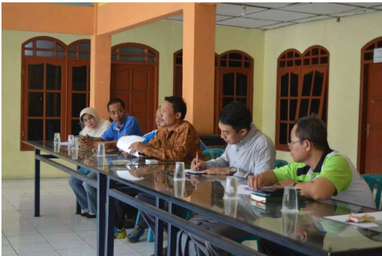
FOTO DOKUMENTASI SOSIALISASI LEGALITAS PRODUK