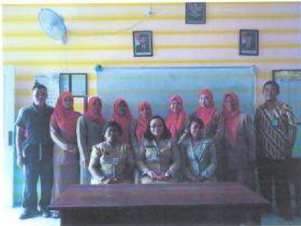
Sesi Foto dokumentasi Narasumber bersama Peserta Pada Workshop Adhanyoti