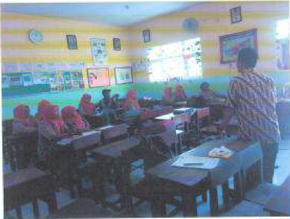
A&Ditas Narasumber berdiskusi dengan Peserta Pada Workshop Adhanyoti