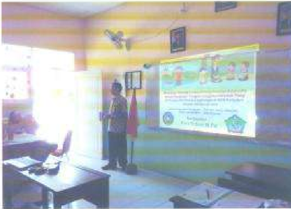
Aktivitas: Sesi Tanya Jawab Oleh Narasumber Dan Peserta Pada Workshop Adiwiyata