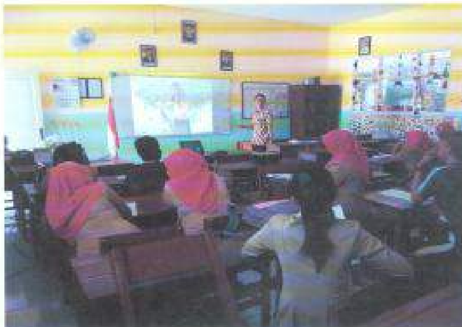
Aktivitas: Sesi Tanya Jawab Oleh Narasumber Dan Peserta Pada Workshop Adiwiyata