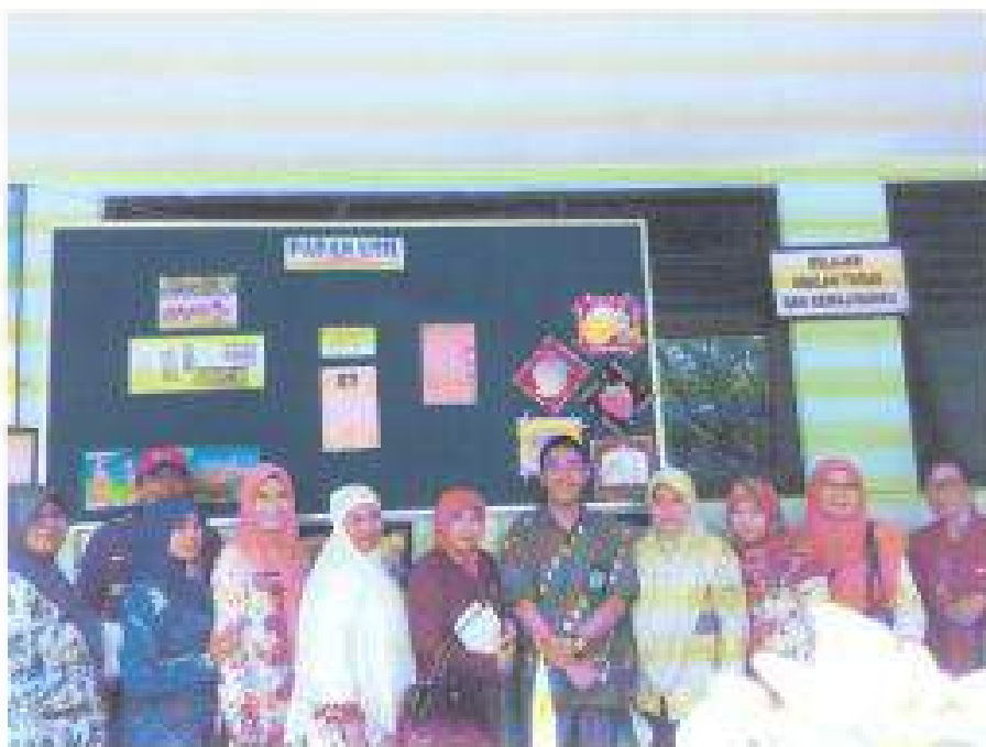
Sesi Foto dokumentasi Narasumber bersama Peserta Pada Sosialisasi Adhwiyyata