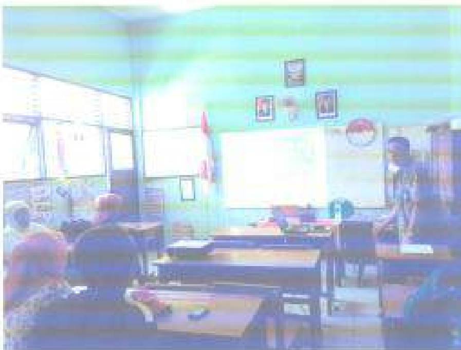
Aktivitas: Narasumber Menjawab Pertanyaan Peserta Pada Sosialisasi Adiwiyata