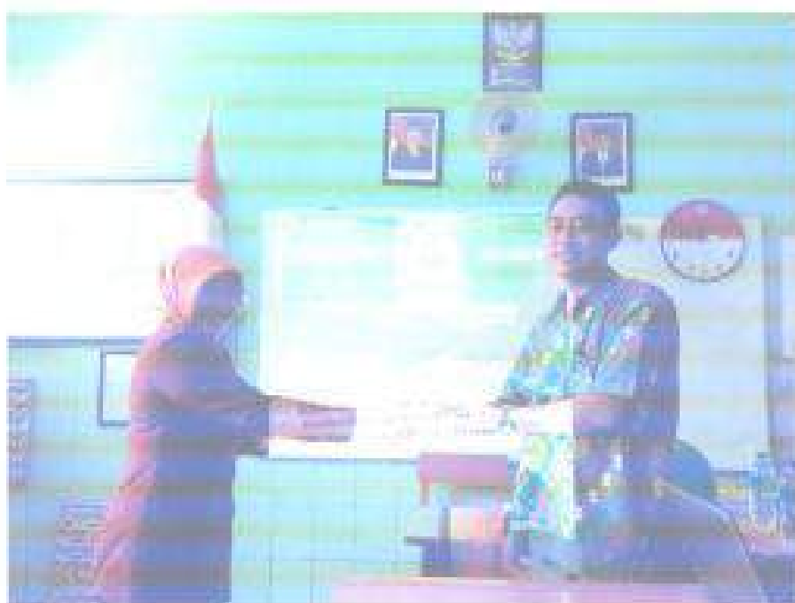
Sesi jabat tangan ucapan terima kasih Kepala Sekolah SDN Wonocolo II kepada Narasumber