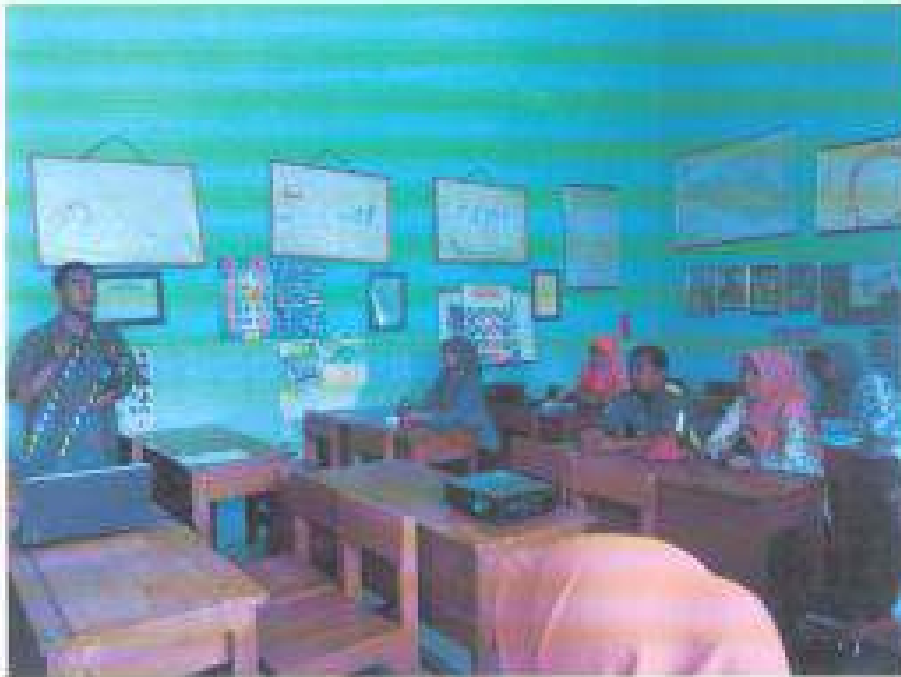
Aktivitas: Sesi Tanya Jawab Oleh Narasumber Dan Peserta Pada Sosialisasi Adiwiyata