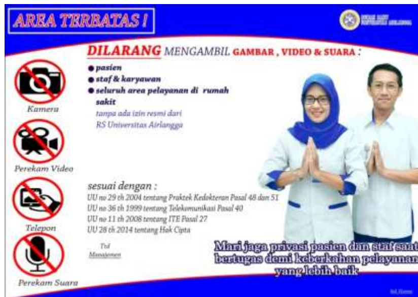
Gambar 1. Aturan Larangan Pengambilan Gambar

Salah satu contoh dari peraturan tentang larangan pengambilan gambar bisa dilihat pada Gambar 1.