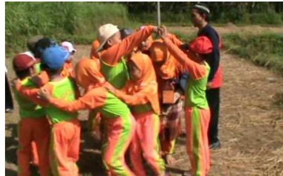
Gambar 1 Posisi Pemain Saat Permainan Berlangsung

pundak pemain yang berada di depannya. Keadaan pemain dan jalannya pemain dalam permainan dapat dilihat pada gambar 1 dan 2 berikut.