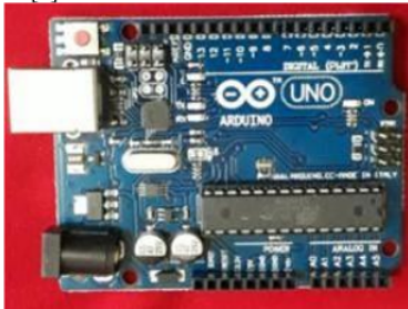
Gambar 1.1 Aruinu Uno

Arduino-Uno adalah sebuah papan/board I/O berisi 14pin, berbasis microcontroller-ATMEGA328 6pin sebagai keluaran PWM dan 6pin sebagai masukan analog, sedangkan osilator crystal 16MHz yang terkoneksi USB, dan juga untuk tombol reset.[4]