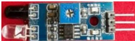
Gambar 1.4 Modul sensor infrared

2 Sebuah alat penting dari sebuah sensor ini yaitu pemancar sinar dan penerima pantulan sinar, yang disebut Infra merah/ Infrared Light Emitting Diode (IR LED), biasa digunakan untuk memancarkan cahaya, dan photodiode diperlukan untuk menerima cahaya yang dipantulkan dari sinar infrared (cahaya sinar merah). Modul penerima dan pembanding tegangan untuk pantulan inframerah dari pemancar dalam modul sensor inframerah, di mana bagian pemancar LED inframerah oleh IC LM393.[10]