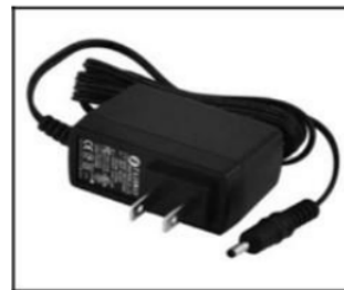
Gambar 1.2 Adaptor Power DC atau catu daya DC

Arduino bersumber tegangan dari 6 sampai 20 volt. Jika tegangan suplai kurang dari 6V, 5VPin akan menghasilkan dibawah 5V yang bisa berakibat board/papan menjadi kurang maksimal fungsinya dan jika memakai tegangan di atas 12V dapat menyebabkan regulator tegangan menjadi melebihi suhu dan berakibat kerusakan pada papan sirkuit. Seharusnya perkiraan yang direkomendasikan diantara 6-12 volt. Kabel baterai dapat dihubungkan ke terminal Ground dan Vnd berpusat di connector daya, ada baiknya diperlukan pengatur tegangan guna menciptakan arus (DC) maupun arus konstan/stabil sebagai pengatur tegangan keluaran yang tidak tergantung di suhu dan arus beban, maupun arus masuk yang berasal dari filter keluaran maka regulator tegangan biasanya meliputi diode Zener, transistor dan sirkuit terpadu.[8] Dalam catu daya DC yang kompleks, regulator tegangan biasanya juga memiliki perlindungan hubung singkat, pembatasan arus, atau perlindungan tegangan berlebih.