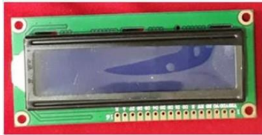
Gambar 1.3 LCD(Liquid Crystal Display)

dikenal sebagai backlight, atau memantulkan cahaya yang dibawa ke cahaya depan dari lampu depan. Layar LCD biasanya sebagai layar yang menampilkan data berupa angka, huruf, karakter serta grafik. Pada modul LCD(Liquid Crystal Display) terdapat Microcontroller yang bertugas menjadi pengontrol layout character dengan memory dan juga gambar[9]