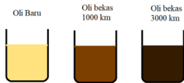
Gambar III.1 Jenis pelumas yang akan diuji

Pada langkah selanjutnya ialah langkah pengambilan data, proses pengujian ini yang pertama, dilaksanakan menggunakan scenario pengambilan pelumas oli menurut jarak tempuh sepeda motor yang bertujuan sebagai menimbulkan 3 jenis pelumas yang akan dilakukan pengujian penelitian, dari tergantung jarak jalannya mesin sepeda motor tersebut pada tempuh hitungan kilometer dan masih menggunakan pelumas oli yang tetap.