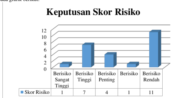
Gambar 1. Grafik Keputusan Skor Risiko

Untuk mempermudah menganalisa penentuan prioritas risiko, maka akan di tentukan keputusan skor risiko, yang dapat dilihat pada grafik berikut: