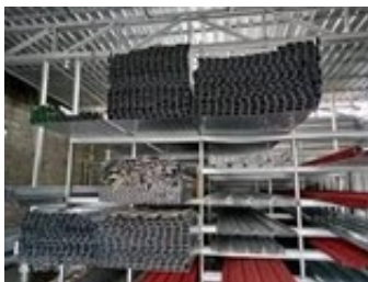
Figure 6. Produk Jadi Baja Ringan

Setelah melalui proses mesin decoiler , produk akan dikirim kepada tim quality control (QC) untuk diperiksa kelayakan produk tersebut apakah sudah sesuai dengan standarisasi perusahaan atau tidak, sebelum dipasarkan kepada konsumen. Selanjutnya produk jadi akan dipindahkan ke gudang untuk disimpan sebelum sampai di tangan konsumen.