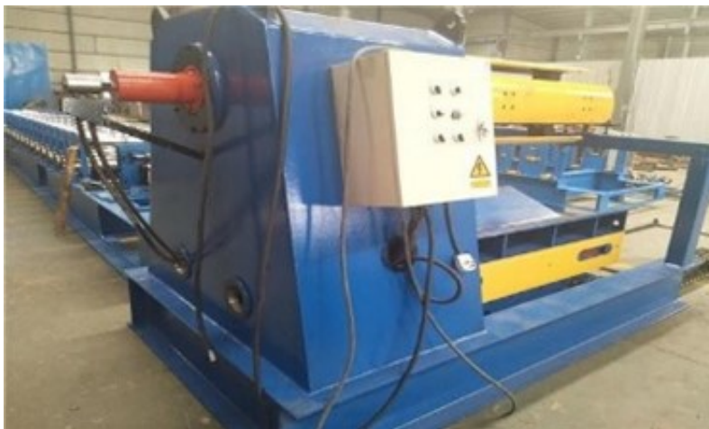
Figure 5. Mesin Decoiler

Proses kedua yaitu operator mesin decoiler mengoperasikan kuantiti di monitor panel agar sesuai dengan ukuran dan presisi. Setelah proses pembentukan produk langsung diarahkan ke mesin cutting untuk pemotongan sesuai ukuran atau permintaan pelanggan dan saat pemindahan, tim dari quality control (QC) akan mensortir produk yang berkualitas atau reject . Mesin decoiler tampak pada gambar 3.