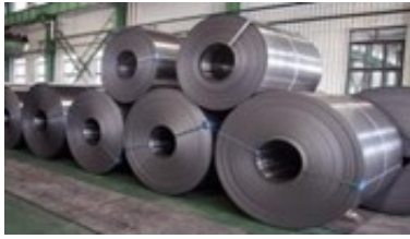
Figure 4. Bahan Baku Galvanis Roll

Proses kedua yaitu operator mesin decoiler mengoperasikan kuantiti di monitor panel agar sesuai dengan ukuran dan presisi. Setelah proses pembentukan produk langsung diarahkan ke mesin cutting untuk pemotongan sesuai ukuran atau permintaan pelanggan dan saat pemindahan, tim dari quality control (QC) akan mensortir produk yang berkualitas atau reject . Mesin decoiler tampak pada gambar 3.