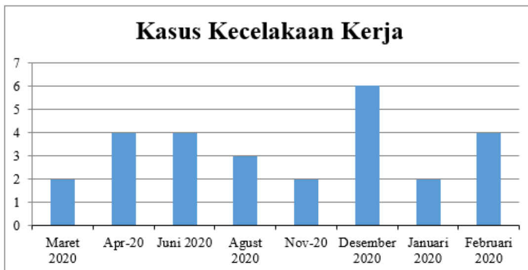
Figure 1. Kasus Kecelakaan Kerja di Area Mesin Roll Forming

Fungsi mesin roll forming melibatkan kontak dekat dengan bahan panas dan bercahaya selama proses peleburan dan penggulangan logam. Karena kualitas bahan baku logam dan mesin berkecepatan tinggi yang panas dan mudah terbakar menimbulkan bahaya dan risiko besar bagi personel, proses ini berbahaya, dan sangat penting untuk mengidentifikasi bahaya yang efektif dalam mencegah kecelakaan di tempat kerja. Gambar 1 menunjukkan berapa banyak kecelakaan yang terjadi di area mesin roll forming karena APD (Alat Pelindung Diri) tidak dipakai saat bekerja.