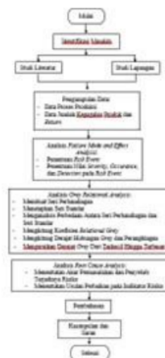
32 Gambar 1. Diagram Alir Penelitian