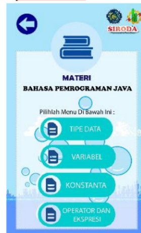
Gambar 3. Tampilan menu pada menu utama Digital Book SIRODA

Menu Utama merupakan halaman yang berisi tentang beberapa menu untuk masuk ke halaman yang akan dituju. Terdapat beberapa menu yaitu materi, video, quiz, profile serta petunjuk. Tombol navigasi pada halaman ini terdapat beberapa tombol yaitu home yang berfungsi untuk memudahkan pengguna untuk kembali ke halaman splash screen serta tombol exit yaitu berfungsi untuk keluar dari halaman menu utama atau keluar dari aplikasi tersebut. Tampilan menu dari menu utama Digital Book SIRODA dapat ditunjukkan pada Gambar 3.