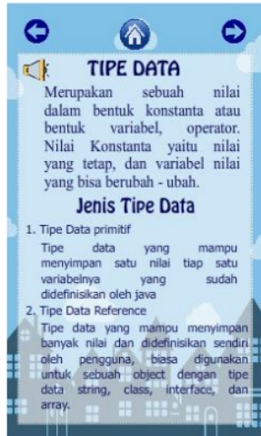
Gambar 4. Tampilan penjelasan jika sub menu diklik

Gambar 3 dan 4 tersebut merupakan tampilan dari halaman menu materi, halaman materi serta halaman menu video praktik. Halaman menu materi terdapat beberapa sub materi yaitu mengenai tipe data, variable, konstanta, operator dan ekspresi. Pada tampilan halaman materi berisikan kumpulan penjelasan materi yang disajikan secara singkat dengan dilengkapi tambahan fitur audio yang bisa dijadikan opsi dalam belajar oleh peserta didik supaya peserta didik dapat menyesuaikan dengan gaya belajar masing – masing. Halaman menu video yang berisikan 2 video pembelajaran yang menjelaskan materi pembelajaran pemrograman dasar dengan dilengkapi praktik di dalam video tersebut, video pertama menjelaskan materi pembelajaran tentang tipe data dan variable, video kedua menjelaskan materi pembelajaran tentang konstanta, operator serta ekspresi. Tampilan menu quiz dapat ditunjukkan pada Gambar 4.