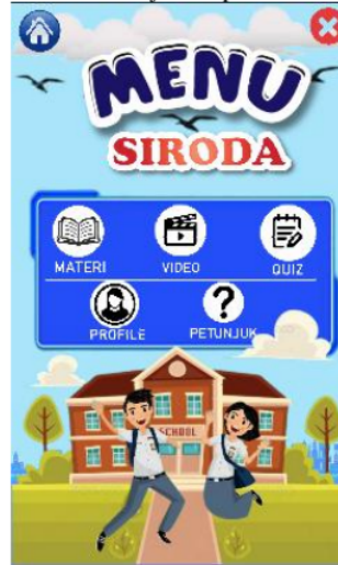
Gambar 2. Tampilan Menu Utama

selanjutnya yang berdurasi selama 5 detik. Tampilan menu utama akan ditunjukkan pada Gambar 2.