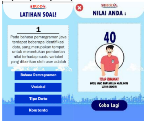
Gambar 4. Tampilan Menu Quiz

Gambar 3 dan 4 tersebut merupakan tampilan dari halaman menu materi, halaman materi serta halaman menu video praktik. Halaman menu materi terdapat beberapa sub materi yaitu mengenai tipe data, variable, konstanta, operator dan ekspresi. Pada tampilan halaman materi berisikan kumpulan penjelasan materi yang disajikan secara singkat dengan dilengkapi tambahan fitur audio yang bisa dijadikan opsi dalam belajar oleh peserta didik supaya peserta didik dapat menyesuaikan dengan gaya belajar masing – masing. Halaman menu video yang berisikan 2 video pembelajaran yang menjelaskan materi pembelajaran pemrograman dasar dengan dilengkapi praktik di dalam video tersebut, video pertama menjelaskan materi pembelajaran tentang tipe data dan variable, video kedua menjelaskan materi pembelajaran tentang konstanta, operator serta ekspresi. Tampilan menu quiz dapat ditunjukkan pada Gambar 4.