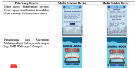
Tabel 2. Revisi Produk

Proses validasi dilakukan untuk validator ahli media, yaitu dosen Universitas Muhammadiyah Sidoarjo serta validator ahli materi, yaitu guru produktif jurusan TKJ di SMK Walisongo 2 Gempol. Hasil persentase penilaian dari ahli media dan ahli materi ditunjukkan pada Tabel 3.