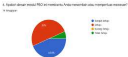
Gambar 2. Angket respon mahasiswa terkait wawasan pemrograman

Penelitian yang dilakukan merupakan penelitian lanjutan untuk mengetahui efektifitas penggunaan modul PBO berbasis PBL. Berdasarkan penelitian sebelumnya diperoleh bahwa modul PBO berbasis PBL ini dinyatakan layak dengan prosentase kelayakan ahli materi sebesar 91,6%, ahli media 97%, dan pengguna 86,8%. Berdasarkan hasil analisis dari uji statistic regresi sederhana diperoleh nilai sig sebesar 0,003, maka 0,05 \geq 0,003 dapat disimpulkan bahwa H_0 ditolak sehingga dapat disimpulkan bahwa terdapat pengaruh yang positif dan signifikan modul pemrograman berorientasi objek berbasis problem based learning terhadap pemahaman konsep pemrograman mahasiswa Pendidikan teknologi Informasi. Hal ini menunjukkan bahwa modul PBO mempunyai pengaruh yang positif terhadap pemahaman konsep pemrograman. Berdasarkan hasil penelitian yang telah dilakukan, dapat disimpulkan bahwa E-module berbasis Problem Based Learning (PBL) pada materi suhu layak untuk meningkatkan keterampilan proses sains siswa untuk siswa SMA (Serevina & Sari, 2018). Berdasarkan hasil pengisian angket respon mahasiswa, modul PBO yang telah dikembangkan dapat menambah atau memperluas wawasan yang ditunjukkan pada Gambar 1.