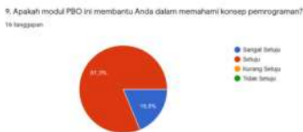
Gambar 3. Angket respon mahasiswa terkait pemahaman konsep pemrograman

Dengan adanya modul yang dilengkapi dengan contoh dan langkah pembuatan program, mahasiswa dapat dengan mudah mempelajari materi, hal ini sesuai dengan penelitian dari (Masruroh, 2015) bahwa pemanfaatan modul pada kegiatan pembelajaran membuat siswa merasa lebih mudah untuk mempelajari materi. Pendekatan PBL mencirikan strategi pembelajaran, di mana siswa dihadapkan dengan masalah kontekstual dan tidak terstruktur yang mereka berusaha untuk menemukan solusi yang bermakna. Jalan menuju solusi memungkinkan penguasaan keterampilan pribadi, interpersonal, dan teknis (Ribeiro & Bittencourt, 2018).