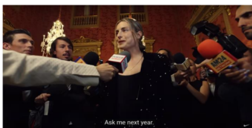
Gambar 4. Cuplikan Iklan Kampanye “Never Settle, Never Done”

Pada gambar 3 dan 4 terlihat banyak wartawan media dan satu orang menjadi pusat perhatian yang diliput dengan cara memotret dan merekam serta menyodorkan mic ke arah perempuan berbaju hitam tersebut. Makna yang terdapat dalam gambar 3 dan 4 ini menampilkan atlet sepak bola, perempuan menjadi pusat perhatian oleh banyaknya wartawan dari berbagai perusahaan media yang sedang melakukan liputan terhadap satu orang yaitu Alexia Putellas pemain sepak bola Spanyol yang bermain sebagai gelandang di klub Barcelona. Wartawan menanyakan kepada Alexia “Is this your best season ever?” yang artinya apakah ini musim terbaikmu, lalu Alexia Putellas menjawab “Ask me next year” yang artinya tanya saya tahun depan. Dalam dialog tersebut memperlihatkan bagaimana wartawan memberikan pertanyaan kepada Alexia Putellas, apakah ini musim terbaikmu, dikarenakan pada tahun itu Alexia Putellas telah mendapatkan The Best FIFA Women's Player dan pemenang Ballon d'Or Féminin 2 tahun berturut-turut pada tahun 2021 dan 2022, lalu Alexia menjawab tanya saya tahun depan, arti dari perkataan Alexia Putellas ini memperlihatkan bagaimana dia tidak perlu menjawab pertanyaan