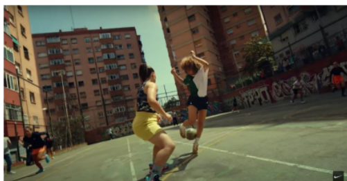
Gambar 1. Cuplikan Iklan Kampanye “Never Settle, Never Done”

Dalam iklan Nike Never Settle, Never Done yang saat ini masih tayang di media online YouTube, peneliti membagi beberapa adegan yang memiliki makna kuat dalam menyampaikan pesan yang ingin disampaikan oleh iklan tersebut dengan menggunakan teori semiotika Roland Barthes, dimana dalam semiotika model Roland Barthes berfokus pada aspek non verbal seperti cultural meaning dan visual sign , dalam semiotika Roland Barthes menjelaskan ada tiga tingkatan tahapan penandaan yang memungkinkan dihasilkannya makna dan pesan, yaitu tingkatan denotasi, konotasi dan mitos.