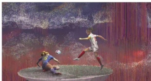
Gambar 5. Cuplikan Iklan Kampanye “Never Settle, Never Done”

Adegan dalam gambar 3 dan 4 memperlihatkan bagaimana banyaknya media yang sedang melakukan liputan terhadap satu orang perempuan yakni Alexia Putellas. Alexia Putellas merupakan atlet sepak bola yang memenangkan penghargaan Ballon d’Or Féminin 2 kali berturut turut pada tahun 2021 dan 2022. Dalam hal ini menunjukkan bagaimana atlet perempuan memperlihatkan kemampuan mereka dalam olahraga sepak bola sehingga meraih sebuah penghargaan dan perhatian oleh media. Media dalam olahraga sepakbola cenderung lebih menonjolkan atlet sepak bola laki-laki dikarenakan masih banyaknya anggapan bahwasannya sepak bola adalah olahraga laki-laki, sehingga dalam hal ini membuat sepak bola perempuan kurang mendapat perhatian media karena dianggap kurang kompetitif. Hal ini didukung oleh (Rasmussen et al., 2021), yang menyatakan bahwa atlet laki-laki menerima sebagian besar perhatian media, dengan hanya sebagian kecil yang didedikasikan untuk atlet olahraga perempuan.