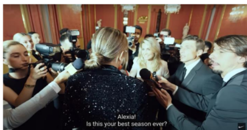
Gambar 3. Cuplikan Iklan Kampanye “Never Settle, Never Done”

Adegan diatas memperlihatkan gambaran sosok pelatih kepala perempuan yang sedang melakukan instruksi dan memotivasi kepada anak asuhnya untuk melakukan berbagai cara agar meraih sebuah kemenangan. Dalam adegan ini menunjukkan bagaimana perempuan juga dapat menjadi seorang pemimpin dan menjadi sosok panutan oleh orang lain. Hal ini mematahkan stereotip dan anggapan masyarakat bahwasannya pelatih sepak bola identik dengan laki-laki dikarenakan laki-laki identik sebagai sosok seorang pemimpin. Permasalahan ini dikarenakan secara khusus. Pelatih perempuan diwakili dalam literatur penelitian sebagai menempati posisi di mana mereka memiliki kekuatan yang relatif kecil sementara laki-laki diberi posisi kekuasaan dan berfungsi sebagai "pemegang kekuasaan" (Fasting, Sand, & Nordstrand, 2017).