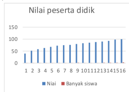
Gambar 2. Nilai peserta didik

sebanyak 1 peserta didik, nilai 63 sebanyak 1 peserta didik, nilai 68 sebanyak 1 peserta didik, nilai 73 sebanyak 1 peserta didik, nilai 75 sebanyak 1 peserta didik, nilai 76 sebanyak 1 peserta didik, nilai 80 sebanyak 2 peserta didik, nilai 83 sebanyak 1 peserta didik, nilai 85 sebanyak 1 peserta didik, nilai 88 sebanyak 1 peserta didik, nilai 90 sebanyak 2 peserta didik nilai 93 sebanyak 2 peserta didik, nilai 98 sebanyak 2 peserta didik dan nilai 100 sebanyak 3 peserta didik. Terlihat pada gambar.2 diagram batang pemerolehan nilai peserta didik kelas IV-B terhadap pengaruh media audiovisual terhadap pemahaman peserta didik.