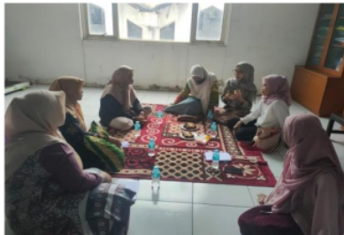
Gambar 1. Proses sosialisasi dan pendampingan terkait dengan tata kelola keuangan

Selanjutnya tim pengabdian melaksanakan pendampingan kepada mitra dalam pembuatan estimasi cadangan kerugian piutang yang didasarkan pada lama umur piutang. Metode analisis piutang berdasarkan pada asumsi bahwa semakin lama piutang tidak dilunasi, semakin kecil kemungkinan piutang akan tertagih. Menghitung umur piutang ( aging the receivable ) adalah proses pembuatan daftar umur piutang untuk diterapkan pada laporan keuangan Koperasi Dinar Amanta periode 2020. Kegiatan tersebut disajikan pada Gambar 1.