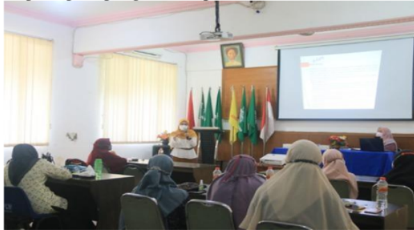
Gambar 3. Proses demonstrasi dan pengenalan program aplikasi

Setelah program aplikasi tersebut jadi, diadakan demonstrasi untuk pengenalan program serta dilanjutkan dengan pelatihan untuk penggunaan aplikasi tata kelola keuangan koperasi kepada para pengurus Koperasi Dinar Amanta (Gambar 3).