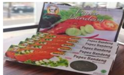
Gambar.5 desain packaging pepes bandeng

Pelatihan tentang pengolahan, pengemasan, dan pemasaran yang dilakukan dalam 2 kali tatap muka telah memberikan bekal kepada anggota Aisyiyah. Menurut mereka pelatihan ini sangat bermanfaat bagi mereka yang sudah punya usaha untuk mengembangkan usahanya lebih luas, sedangkan bagi anggota Aisyiyah yang belum punya usaha menjadikan bekal untuk mereka bisa memulai usaha sebagai usaha untuk lebih mandiri dalam ekonomi keluarga. Inilah modal perempuan Aisyiyah mandiri dalam