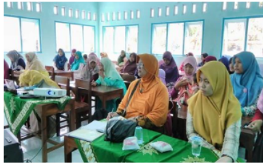
Gambar.3 Pengajian Tema Kewirausahaan

Dari kegiatan pengajian tematik yang telah dilaksanakan dalam empat pertemuan menarik anggota Aisyiyah golongan ibu-ibu muda, mereka merasa ada pengetahuan baru yang didapatkan, bahkan beberapa berkomentar belum pernah mendapatkan informasi yang disampaikan di pengajian tersebut.