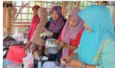
Gambar.4 Pelatihan membuat olahan Ikan

Dari hasil data yang terkumpul 75% anggota aisyiyah memiliki usaha produk olahan ikan, diantaranya: krupuk, abon, pepes telur ikan dan pepes ikan. Maka pelatihan pertama yang dilakukan adalah: pengolahan produk secara sehat dan halal. Tim pengabdian bekerjasama dengan laboratorium Teknologi Pengolahan Hasil Pangan Umsida memberikan pelatihan tersebut.