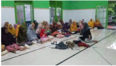
Gambar.1 Pengajian Tema Pola pengasuhan anak