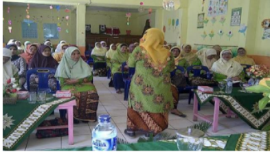
Gambar.2 Pengajian Tema Kesehatan Ibu dan Anak