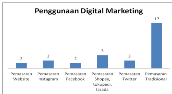
Gambar 5. Hasil Survey Penggunaan Digital Marketing

terimplementasikan dimana hanya sebuah rencana saja dalam perancangan strategi hal ini disebabkan karena 4) sumber daya manusia yang kurang serta 5) modal yang kurang terutama bagi para pelaku UMKM dan 6) pelatihan yang belum maksimal yang disebabkan karena pendampingan yang kurang merata. Berdasarkan hasil survey dapat ditunjukkan implementasi digital marketing yang digunakan oleh UMKM dapat dijelaskan sebagai berikut: