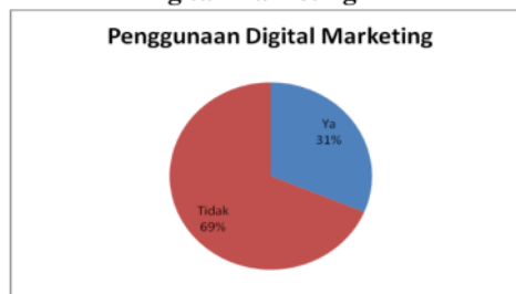
Gambar 3: Hasil Survey Penggunaan Digital Marketing

mengimplementasikan penggunaan digital marketing dalam proses transaksi jual belinya hal ini ini dapat di paparkan pada gambar 3 sebagai berikut: