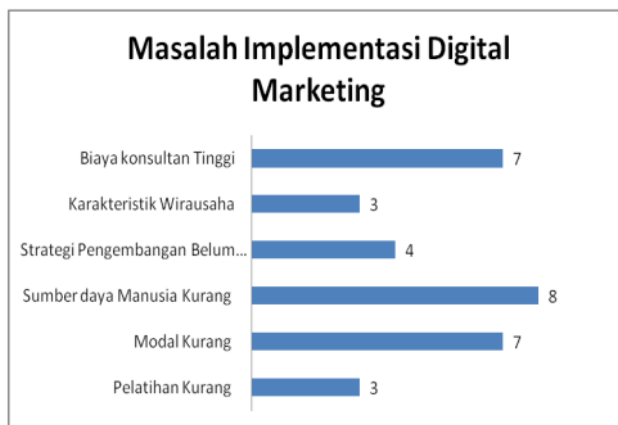
Gambar 4: Hasil Survey Masalah Implementasi Digital Marketing

Hasil survey pada grafik 3 diatas dapat dijelaskan bahwa 32% UMKM di Kota Sidoarjo menggunakan Digital Marketing dalam proses jual beli dan sisanya 69% menggunakan cara tradisional dalam proses jual belinya. Hal ini di sebabkan oleh beberapa alasan mengapa para UMKM belum mampu untuk mengimplementasikan digital Marketing yaitu dapat dipaparkan dalam gambar 4 di bawah ini: