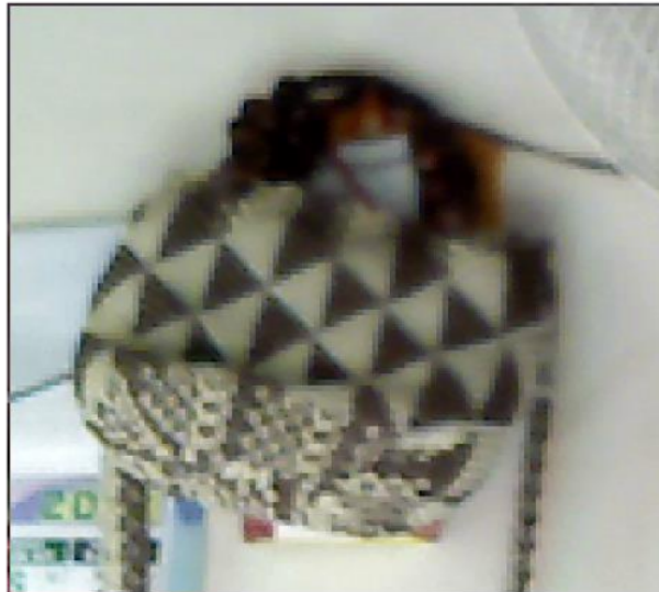
Gambar 4. Hasil citra Zoom Image Enhancement dengan metode Biliner Interpolation skala 2

Pengambilan citra objek tas (gambar 3) didalam ruangan pada waktu siang menggunakan pencahayaan sinar matahari. Proses cropping digunakan untuk memilih objek yang akan diproses zoom . Contoh hasil proses zoom yang sudah dilakukan dengan menggunakan metode Bilinear Interpolation ditunjukkan pada gambar 4.