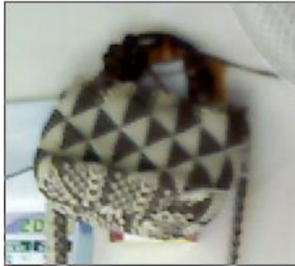
Gambar 3. Citra hasil Crop dari kamera Webcam

Pengujian dilakukan pada objek yang diambil dari kamera webcam didalam ruangan ataupun diluar ruangan pada siang hari atau terdapat cahaya yang dapat membantu objek terlihat. Contoh citra proses cropping diambil dari kamera webcam dengan jarak 1 meter ditunjukkan pada gambar 3.