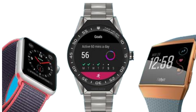
Gambar 1. Ragam Smartwatch yang ada dipasaran saat ini.

Smartwatch merupakan wearable electronic device yang mempunyai fitur lebih dibanding jam tangan biasa. Jam tangan pintar ini mampu menyediakan banyak fungsi untuk pengguna dan berkembang sangat pesat dalam beberapa tahun ini. Perkembangan teknologi dalam integrasi dan miniaturisasi elektronik mampu mengemas perangkat bergerak menjadi lebih kecil ukurannya [2]. Pada awal tahun 2000, IBM berkolaborasi dengan produsen jam tangan dari Jepang, yaitu Citizen, untuk meluncurkan sebuah smartwatch bernama Watch Pad dengan Linux sebagai sistem operasinya. Kemudian, dilanjutkan pada tahun 2004, Microsoft mendesain sistem SPOT untuk smartwatch . Samsung juga meluncurkan smartwatch pertamanya pada tahun 2013, yang bernama smartwatch Galaxy Gear dengan Android sebagai sistem operasinya. Selanjutnya, pada Maret 2014, Google meluncurkan smartwatch berbasis android yang memiliki sistem operasi Android wear [3].