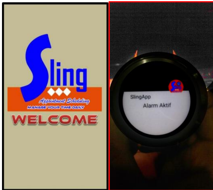
Gambar 3. Menu Aplikasi SLING Versi 1.3.