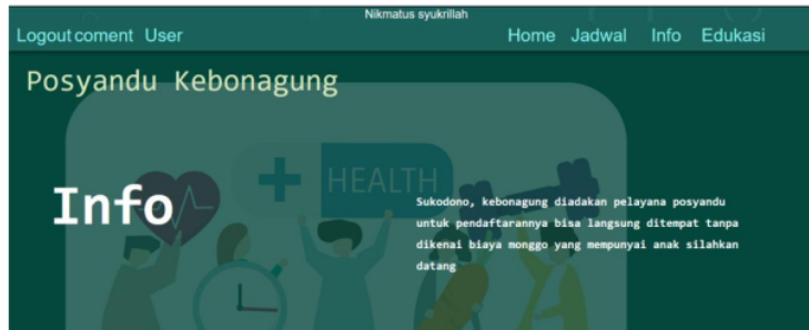
Gambar 5. Halaman Home

14 Gambar 5. Halaman home merupakan halaman awal setelah login yang berisi menu-menu untuk pelayanan kesehatan seperti halaman jadwal, halaman info, halaman edukasi, halaman user, dan halaman coment.