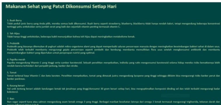
4 Gambar 10. Halaman Edukasi

Gambar 10. Halaman Edukasi merupakan satu menu yang memberikan ulasan-ulasan tentang posyandu balita seperti pengertian makanan sehat dll.