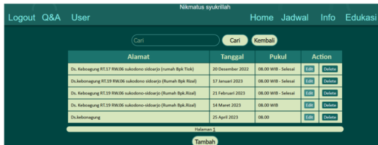
Gambar 6. Halaman Jadwal