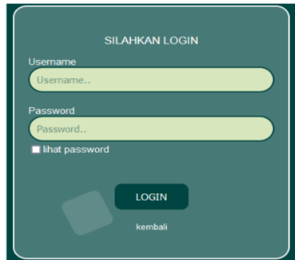
Gambar 4. Halaman Login

Gambar 4. Halaman login merupakan halaman dari website yang berguna untuk masuk ke halaman website dengan cara memasukkan password & username yang sudah di bikin di halaman daftar.