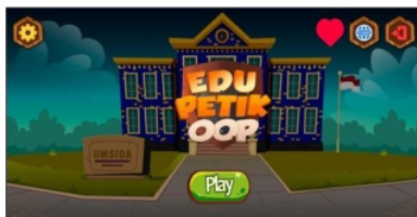
Gambar 3. Halaman Utama Game Edukasi

Desain antarmuka pengguna latar pada gim edukasi ini sebelum diolah pada gim engine ditunjukkan pada Gambar 3.