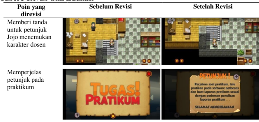
Tabel 3 Revisi Gim Edukasi

Berdasarkan Tabel 2 diperoleh persentase ahli materi yang meliputi indikator isi materi 93,2 % dan bahasa 93,3% dengan kriteria sangat tinggi. Persentase ahli media dengan indikator kualitas isi, yaitu 90 %, desain dan audio 95%, serta interaksi dan umpan balik 93,75% dengan kriteria sangat tinggi, sehingga dapat disimpulkan gim edukasi dinyatakan layak dan dilanjutkan untuk tahap uji coba skala terbatas. Pendapat dan saran pada penilaian yang diperoleh digunakan sebagai revisi untuk memperbaiki prototipe gim edukasi yang telah dibuat. Revisi yang dilakukan sesuai masukan dari validator ahli materi dan media ditunjukkan pada Tabel 3.