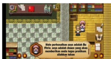
Scene Karakter Jojo Menerima Misi