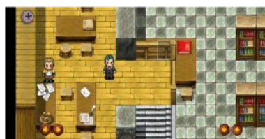
Scene Awal Gim Edukasi

Tahap develop merupakan tahap pembuatan produksi atau pengembangan gim edukasi. Jenis gim edukasi yang digunakan pada penelitian ini, yaitu jenis Role Playing Game (RPG). Gim berjenis RPG memiliki banyak variasi dan dinamika permainan yang dapat digunakan sebagai mekanisme untuk meningkatkan efektivitas pembelajaran. Skenario dengan menjadikan pemain sebagai tokoh utama dapat membantu penyampaian materi yang diajarkan di dalam permainan (Hermawan et al., 2017). Pengembangan gim dibuat sesuai dengan storyboard , dimulai dari pembuatan desain antarmuka pengguna, karakter dalam bentuk grafik, dan dikombinasikan dengan perangkat lunak game engine dengan pemberian fungsi dengan kode program. Pembuatan desain antarmuka pengguna menggunakan perangkat lunak desain grafis, yaitu Adobe Illustrator CC 2019 dan Affinity Designer. Gambaran tampilan antarmuka pengguna perjalanan Jojo menuju karakter Dosen ditunjukkan pada Gambar 4.