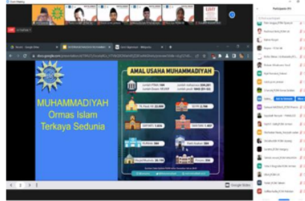
Gambar 2. Paparan Ahmad Norma Permata, M.A., Ph.D.

Dalam Paparannya Ahmad Norma Permata (2022) menyebutkan bahwa makna gerakan internasionalisasi Muhammadiyah adalah gerakan organisasi kearah lebih baik dan amal usaha yang dimiliki harus sistematis dan berkelanjutan di luar negeri. Untuk mewujudkan gerakan internasionalisasi tersebut, diperlukan desain yang tepat melalui tahapan-tahapan sebagai berikut, yaitu: (a) PCIM harus membangun basis jamaah yang jelas (baik warga negara Indonesia di luar negeri maupun warga negara asli negara tersebut) dan kenalkan Muhammadiyah sebagai gerakan amal, misalnya memberikan solusi terhadap pengentasan kemiskinan/penolong kesengsaraan umat; (b) membangun basis data kondisi masyarakat setempat, temukan faktor sumber daya manusia yang bisa diperbaiki; (c) membuat kegiatan publik dan mendirikan amal usaha Muhammadiyah, misalnya masjid. Masjid ini merupakan amal usaha Muhammadiyah, amal usaha muhammadiyah yang lain yang berdimensi ekonomi setelah jamaah Muhammadiyah terbentuk; dan (d) mengajak warga sekitar (baik warga negara Indonesia di Jerman maupun warga negara asing untuk menjadi kader/simpatikan Muhammadiyah, mendampingi mereka untuk mengembangkan amal usaha Muhammadiyah di Jerman dan Hongaria.