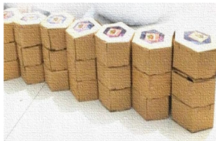
Gambar. 5. Kemasan produk

Diera yang serba digital saat ini, semua kalangan masyarakat rata-rata sudah bisa menggunakan teknologi (HP) terutama bagi kalangan ibu-ibu PKK dan para ibu-ibu rumah tangga. Dalam hal ini, Kelompok KKN-P 77 memberikan pelatihan tentang pemasaran produk “Bola-bola Ubi” yang mana dapat dilakukan dengan cara di pasarkan melalui media sosial seperti Instagram, Facebook, WhatsApp, dll. Kelompok KKN menjelaskan bahwa pemasaran produk yang dilakukan dengan menggunakan media sosial, maka peminat pembelinya akan jauh lebih banyak dibandingkan dengan berjualan tanpa menggunakan media sosial.