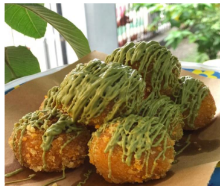
Gambar. 2. Produk jadi

Dari proses pembuatan Bola-bola Ubi tersebut dapat dijadikan motivasi untuk berwirausaha bagi warga desa Watesnegoro, selain itu juga dapat digunakan untuk menciptakan lapangan pekerjaan baru bagi ibu-ibu rumah tangga. Kegiatan pelatihan pembuatan Bola-Bola Ubi tersebut memanfaatkan waktu luang warga agar