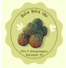
Gambar. 4. Logo produk

Dalam sebuah UMKM pemasaran sebuah produk merupakan salah satu hal terpenting yang harus dilaksanakan, hal ini bertujuan untuk memperkenalkan produk yang akan dijual kepada masyarakat agar dapat menarik perhatian konsumen. Kelompok KKN memberikan penjelasan bahwa sebelum memasarkan sebuah produk alangkah baiknya melakukan branding dengan cara membuat nama produk terlebih dahulu, design kemasan, dan membuat logo produk. Dalam hal ini Kelompok KKN kemudian memberikan contoh kepada ibu-ibu PKK dengan menciptakan suatu produk makanan yang diberi nama “Bola-bola Ubi”, logo produknya diletakkan pada bagian atas kemasan yang berbentuk stiker yang menarik, design kemasannya menggunakan bangun ruang segi enam, serta penerapan digital marketing pada strategi pemasaran menambah nilai plus pada produk “Bola-bola Ubi” ini. Dalam berwirausaha branding merupakan salah satu hal terpenting yang harus dilakukan, sebab jika tidak adanya branding dengan baik maka usaha yang dilakukan tidak akan berjalan dengan baik dan peminat pembelinya akan sedikit.