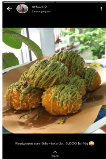
Gambar. 6. Pemasaran produk melalui WhatsApp