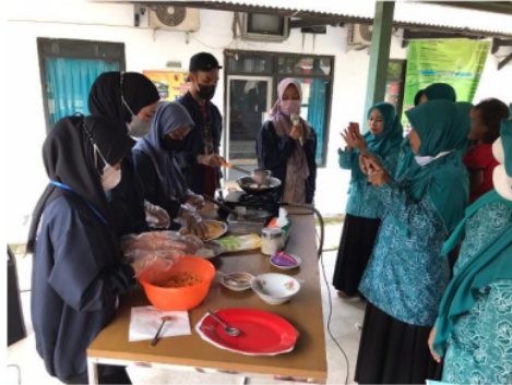
Gambar. 3. Pelatihan pembuatan produk bola-bola ubi bersama ibu-ibu PKK

lebih produktif dan kreatif dalam berwirausaha. Proses pembuatan Bola-bola Ubi tersebut tidak membutuhkan waktu yang cukup lama, untuk itu jenis usaha Bola-bola Ubi ini sangat cocok apabila diterapkan terhadap ibu-ibu warga dusun Watesnegoro. Dari pelatihan yang sudah Kelompok KKN laksanakan, banyak ibu-ibu PKK yang sangat antusias untuk mencoba membuat produk cemilan Bola-Bola Ubi tersebut sehingga dapat dikatakan bahwa produk yang dihasilkan oleh Kelompok KKN bisa memberikan manfaat terhadap warga-warga dusun Watesnegoro.