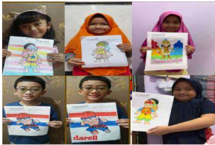
Gambar 3. Hasil Pewarnaan Wayang oleh Anak-anak Sidoarjo

Upaya untuk mengenalkan mencintai wayang kepada anak-anak diawali dengan mewarnai wayang. Sidoarjo mempunyai warna karakter budaya yang kuat mulai dari sejarah Jenggala, Majapahit sampai masa perlawanan terhadap penjajahan Belanda (Susilo, Suwarta, & Taufiq, 2019). Kondisi generasi desa Tambak Kalisogo saat ini sudah semakin jauh dari pengetahuan budaya lokal yang sesungguhnya berpotensi sebagai pembentuk karakter cinta tanah air Indonesia. Berikut adalah pendekatan budaya bagi anak-anak generasi Sidoarjo supaya semakin cinta terhadap kekayaan lokal pengetahuan luhut. Dimulai dari mewarnai wayang, latihan pertunjukan wayang, sampai bercerita atau mendongeng kisah-kisah Wayang Silat Jawisogo.