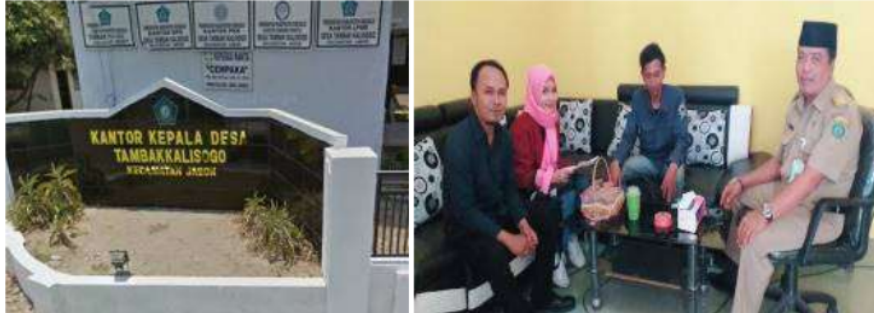
Gambar 1. Dosen dan mahasiswa Umsida melakukan pendekatan kepada mitra di Desa TambakKalisogo.

ditumbuhi tanaman, pepohonan lebat. Hutan alami belum ada kerusakan oleh perbuatan manusia. Dahulu banyak masyarakat dari desa Bangil pergi ke desa Bluru untuk bekerja. Masyarakat tersebut pergi ke desa Bluru mencari penghidupan, para pejalan kaki secara berkelompok. Karena jauhnya jarak dari desa Bangil ke desa Bluru, masyarakat itu sering melepas lelah di lokasi yang sekarang telah berubah menjadi desa Tambak Kalisogo” (Alimah, 2019).