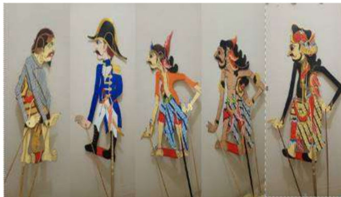
Gambar 5. Hasil Jadi Wayang Karakter Silat Jawisogo