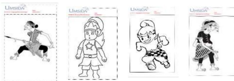
Gambar 2. Desain Wayang Untuk diwarnai Anak-anak

Karakter Wayang Silat Jawisogo dibuat bersama antara tim dari Umsida dengan anak-anak dan remaja desa Tambak Kalisogo. Wayang tersebut terbuat dari kulit, mika, dan kertas art karton tebal 300gsm. Selanjutnya wayang diwarnai dengan beberapa warna yang meriah bagi anak-anak supaya mereka bisa tertarik ketika dipertontonkan.