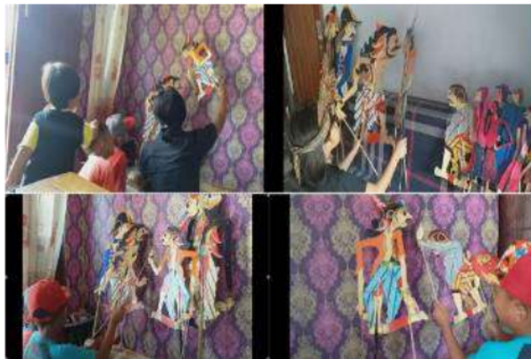
Gambar 6. Praktik Pementasan

Praktik pementasan ini meliputi latihan menggerakkan wayang dan latihan penggunaan bahasa atau dialog wayang. Bahasa yang digunakan adalah bahasa Jawa sederhana yang dapat dipahami oleh anak-anak dan remaja di Sidoarjo, dan disisipkan tata krama bahasa Jawa misal tokoh yang berusia muda (Kang Mas Adipati Reksa) menggunakan bahasa krama kepada tokoh yang tua (mbah Supomo). Latihan penekanan bahasa juga penting misalnya kalimat perintah dan kalimat tanya. Pengetahuan fungsi kalimat penting diperhatikan oleh seorang penutur (Dalang). Mitra tutur harus dapat menangkap bentuk perintah dari penutur (Hasanudin, 2018)