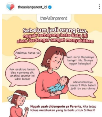
Gambar 2. Tampilan salah satu postingan akun theAsiaparent Indonesia

Keterangan untuk gambar 1. Tampilan akun dan Postingan Akun Instagram theAsiaparent Indonesia, merupakan akun sosial intagram yang memberikan seputar informasi tentang dunia parenting, dimana banyak dibahas seputar kesehatan ibu dan anak, pola asuh anak yang tepat, serta tumbuh kembang normal anak, berdasarkan standarisasi World Healt Organization (WHO), Dokter Spesialis Anak (DSA) dan sumber lain yang telah jelas kapabilitasnya. Akun instagram theAsiaparent Indonesia dapat dilihat, sampai saat ini telah memiliki 831K pengikut yang didominasi oleh kaum Ibu, yang menggunakan teknologi sebagai akses E-Health .