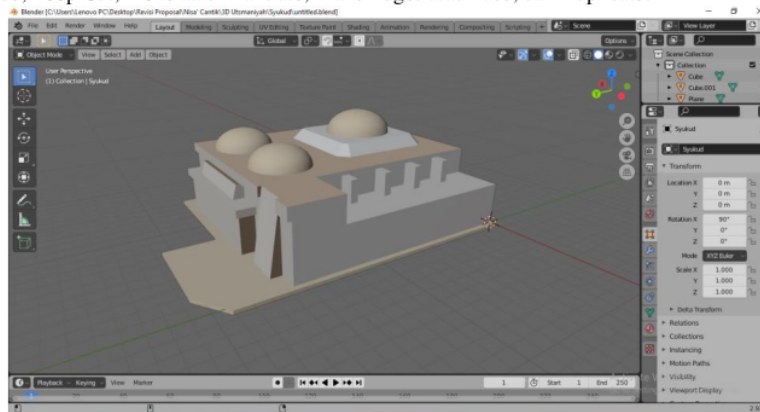
Gambar 4. Hasil Modelling

Pada tahap ini akan dibuat pemodelan objek 3D untuk tokoh, tempat dan peristiwa. Dimana objek dasarnya adalah sebuah cube. Dalam tahap modelling ini menggunakan beberapa tools Blender 3D diantaranya Scale, Rotate, Smooth Vertex, Extrude, Loop Cut, Move atau Translate, Make Edges atau Face, dan Duplicate.