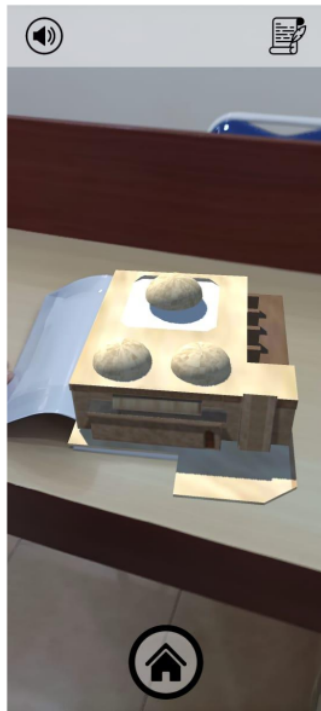
Gambar 6. Tampilan Aplikasi