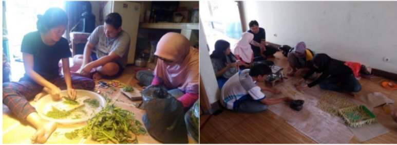
Gambar 1. Kegiatan UMKM Gambir Anom saat memproduksi stik bayam

Kegiatan usaha Kelompok UMKM Gambir Anom semenjak pandemi mengalami penurunan penjualan. Hal ini disebabkan oleh beberapa faktor. Faktor pertama dari sisi produksi. Mitra masih menggunakan cara konvensional dalam proses produksi. Dimana stik dan keripik masih dipotong manual. Sehingga hasilnya tidak rapi, ada yang terlalu panjang dan pendek. Bukan hanya itu hasil stik atau keripik juga kurang kriuk sebab hanya ditiriskan secara konvensional. Produk UMKM Gambir anom berupa minuman sinom dan sari kedelai juga dihadapkan hal yang serupa. Kadar endapan sari sinom dan sari kedelai juga masih banyak serta belum memiliki varian kemasan yang menarik pembeli. Kebijakan pemerintah yang akan mewajibkan seluruh UMKM makanan dan minuman untuk bersertifikat halal pada tahun 2024 semakin membuat mereka resah. Mitra belum memahami bagaimana proses produksi produk halal sehingga produk mitra dapat tersertifikasi halal.