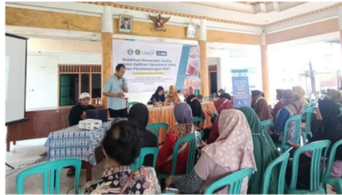
Gambar 4. Kegiatan pendampingan PIR-T

pencantuman kode PIRT, makanan dan minuman produk UMKM Gambir Anom akan lebih mudah dipasarkan dan lebih disukai konsumen hingga bisa meningkatkan daya jual. Hal ini juga menghindari sanksi administrasi atas kasus-kasus seperti melanggar peraturan di bidang pangan, nama pemilik tidak sesuai dengan yang ada di sertifikat, produk tidak aman dan tidak layak dikonsumsi. Selain itu produk - produk olahan pangan UMKM Gambir Anom juga bisa mengikuti pameran yang disediakan Dinas Koperasi dan Usaha Mikro Kabupaten Sidoarjo. Salah satu contoh P-IRT dari mitra binaan dapat dilihat pada Gambar 5.