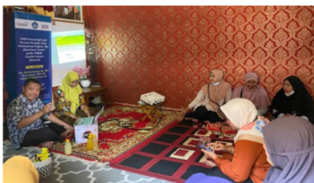
Gambar 2. Kegiatan pelatihan produk halal

Mitra diberi pelatihan terkait bahan-bahan apa saja yang dapat dipastikan kehalalannya, bagaimana memprosesnya sehingga bebas dari titik kritis halal, kegiatan ini ditunjukkan pada Gambar 2. Hasil olahan pangan berupa stik bayam, keripik gayam, sinom, susu sari kedelai dan produk-produk mitra juga akan didampingi untuk dapat memperoleh sertifikat halal melalui pengajuan ikrar/akad self declare , pengajuan ini ditunjukkan pada Gambar 3. Pengajuan sertifikat halal ini juga di dukung oleh Halal Center UMSIDA. Dimana tim pengusul merupakan pendamping proses produk halal (PPH) yang telah mengikuti pelatihan pendamping PPH yang diadakan BPJH Kementerian Agama Republik Indonesia.