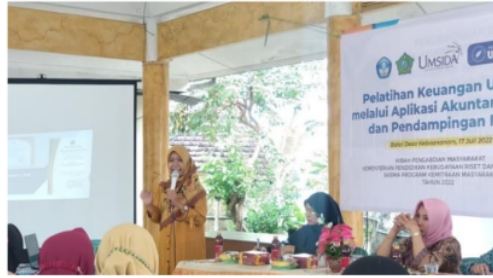
Gambar 6. Pelatihan aplikasi Akuntansi UKM