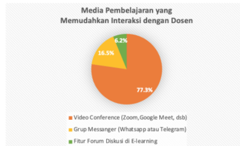
Gambar 1. Persentase Media Pembelajaran yang Memudahkan Interaksi dengan Dosen

Berdasarkan hasil pada Tabel 8 dan Gambar 1 diketahui persentase media pembelajaran yang memudahkan interaksi dengan dosen menurut perspektif mahasiswa. Persentase pilihan media pembelajaran yang digunakan untuk berinteraksi dengan dosen menurut perspektif mahasiswa adalah 77.3 % mahasiswa memilih video conference (Zoom, Google Meet, dsb), 16.5 % mahasiswa memilih grup messenger (Whatsapp atau Telegram) dan 6.2% memilih fitur forum diskusi di E-learning. Berdasarkan hasil penelitian media pembelajaran yang paling memudahkan interaksi dengan dosen menurut perspektif mahasiswa adalah menggunakan video conference (Zoom, Google Meet, dsb.).