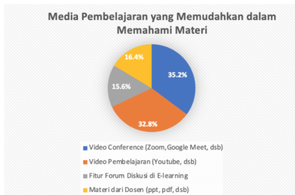
14 Gambar 2. Persentase Media Pembelajaran yang Memudahkan dalam Memahami Materi

Berdasarkan hasil pada Tabel 9 dan Gambar 2 diketahui persentase media pembelajaran yang memudahkan dalam memahami materi menurut perspektif mahasiswa. Persentase pilihan media pembelajaran yang memudahkan dalam memahami materi menurut perspektif mahasiswa adalah 35.2 % mahasiswa memilih video conference (Zoom, Google Meet, dsb), 32.8% mahasiswa memilih video pembelajaran (Youtube, dsb), 15.6% memilih fitur forum diskusi di E-learning dan 16.4 % memilih materi dari dosen (ppt, pdf, dsb). Berdasarkan hasil penelitian media pembelajaran yang paling memudahkan dalam memahami materi menurut perspektif mahasiswa adalah menggunakan video conference (Zoom, Google Meet, dsb) dan video pembelajaran (Youtube, dsb.).