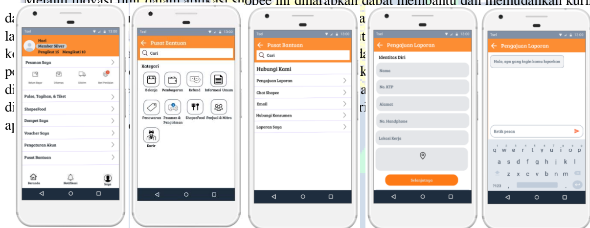
Gambar.1 Tahapan Pelaporan Melalui Fitur Kurir

Melalui inovasi fitur dalam aplikasi shopee ini diharapkan dapat membantu dan memudahkan kurir