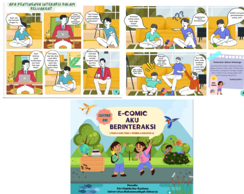
Gambar 3. Prototype 2