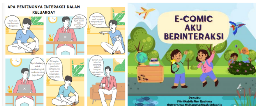
Gambar 2. Prototype 1