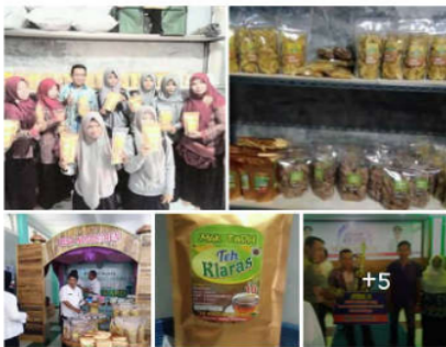
Gambar 6. Pameran Produk UD Mukti Adelia Jaya

Dalam Program Pengabdian Masyarakat ini, mitra ikut turut berpartisipasi dalam membangun konten internet yaitu dengan mempromosikan atau mengupload foto produk secara berkala di media sosial atau web yang telah dibuatkan. Selain itu mitra juga dapat ikut serta menulis artikel tentang apa saja manfaat produk inovasi yang dihasilkan, sehingga informasi produk yang akan dipublikasikan disesuaikan dengan kondisi mitra. Selain promosi produk melalui media online, mitra juga aktif berperan dalam kegiatan pameran-pameran produk yang dilakukan oleh pemerintah daerah maupun pameran produk yang lain. Dengan adanya partisipasi mitra, proses pengenalan produk akan semakin baik, hal ini dikarenakan mitra lebih mengetahui keunggulan produk yang dimilikinya. Pada Gambar 6 pameran produk UD Mukti Adelia Jaya di desa Pasuruan