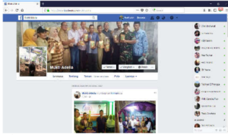
Gambar 5. Facebook UD Mukti Adelia Jaya