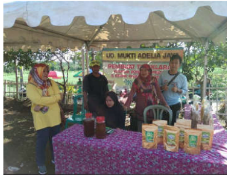
Gambar 7. Pameran Produk UD Mukti Adelia Jaya

Sedangkan Gambar 7 merupakan pameran Produk UD Mukti Adelia Jaya di desa Probolinggo