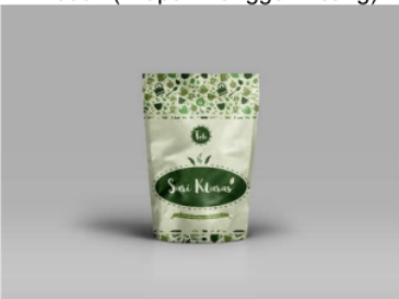
Gambar 3. Desain Komersialisasi Kemasan Produk (Teh Klaras)