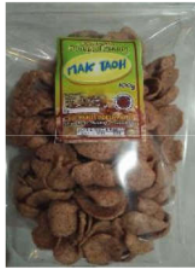
Gambar 1. Kemasan Produk Awal

Dengan adanya kemasan produk yang bagus dan komersial, maka akan meningkatkan ketertarikan pembeli, dan proses promosi kepada khalayak ramai pun akan lebih mudah dilakukan. Berikut merupakan kemasan yang telah di desain yaitu pada Gambar 2 dan Gambar 3 merupakan kemasan hasil komersialisasi kemasan produk.