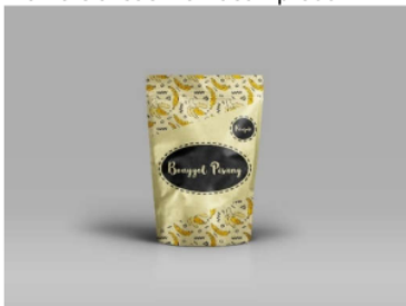
Gambar 2. Desain Komersialisasi Kemasan Produk (Krupuk Bonggol Pisang)

Dengan adanya kemasan produk yang bagus dan komersial, maka akan meningkatkan ketertarikan pembeli, dan proses promosi kepada khalayak ramai pun akan lebih mudah dilakukan. Berikut merupakan kemasan yang telah di desain yaitu pada Gambar 2 dan Gambar 3 merupakan kemasan hasil komersialisasi kemasan produk.