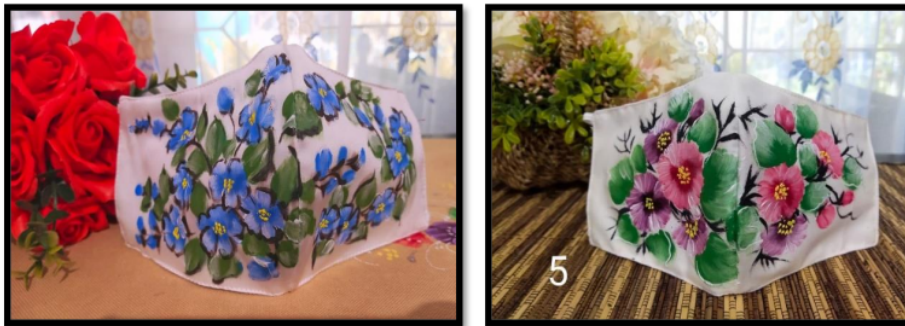
Gambar 3. Hasil Pelatihan Melukis Masker

Sket dasar ini didesain awal oleh tim abdimas kemudian ditempel atau sket pada masker dengan warna polos. Setelah sket ditempel pada masker kemudian masker dilukis dengan menggunakan pewarna tekstil.