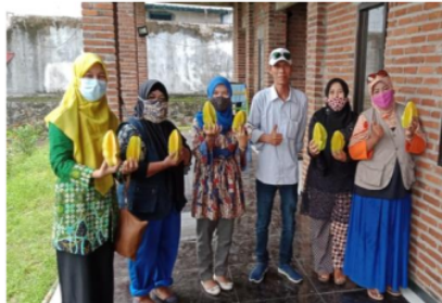
Gambar 2. Survei lokasi di Agrowisata Belimbing Watesari