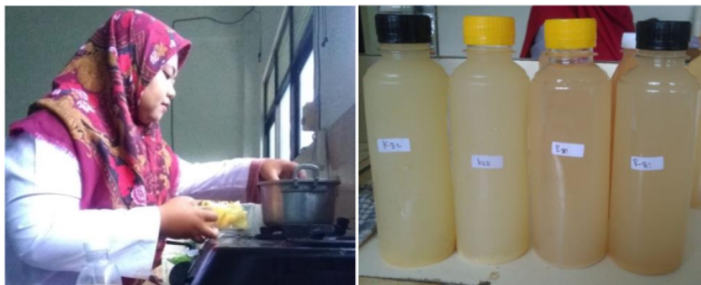
Gambar 3. Uji kandungan di Lab THP Umsida

Sebelum pelatihan olahan buah belimbing, terlebih dahulu tim PKM C19 dibantu oleh mahasiswa melakukan uji di Laboratorium THP UMSIDA untuk menguji pembuatan sari buah belimbing dan keripik belimbing (Gambar 3). Sari buah belimbing sudah siap untuk dipraktikkan oleh mitra, tetapi untuk keripik belimbing masih dalam taraf uji lebih lanjut.