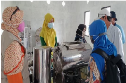
Gambar 1. Pengecekan alat penggorengan kripik belimbing

Program pengabdian kepada masyarakat sudah dilaksanakan sesuai dengan mekanisme yang telah dirancang sebelumnya. Mekanisme kerja program PKM, pertama , tim pengusul melakukan observasi ke lapangan dan melihat kondisi mitra serta permasalahan yang dihadapi mitra dan menawarkan program kepada mitra untuk rencana pelaksanaan program PKM C19 program (Gambar 1-2). Kedua , tim pengusul bertanggungjawab terhadap program yang diusulkan dan berkoordinasi dengan mitra untuk pelaksanaan. Sehingga harapan pengusul, mitra bisa secara mandiri melanjutkan program yang sudah direncanakan bersama dengan berbagai program sosialisasi, pelatihan dan pendampingan.