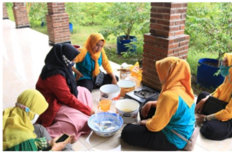
Gambar 6. Pendampingan pengolahan sari buah belimbing