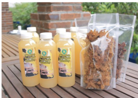
Gambar 7. Hasil olahan buah belimbing