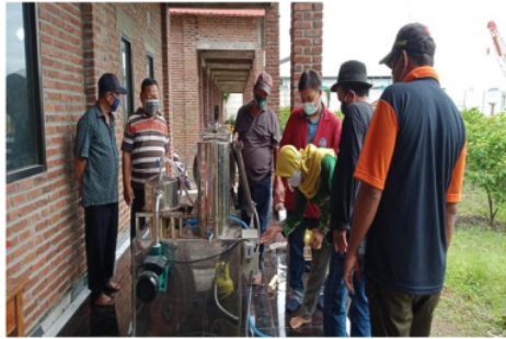
Gambar 5. Pendampingan pengolahan keripik belimbing

Pelatihan dan pendampingan ini disampaikan oleh tim PKM C19 kepada UKM Belimbing Wangi Desa Watesari, bertujuan mengembangkan inovasi dan peningkatan daya saing produk olahan buah belimbing (Gambar 5-6). Pelatihan dan pendampingan yang diberikan berupa pelatihan pembuatan sari buah belimbing yang sudah melalui uji di Laboratorium THP UMSIDA dan keripik buah belimbing masih dalam taraf uji serta bagaimana cara pengemasan yang higienis. Setelah pelatihan pembuatan produk olahan buah belimbing, tahap berikutnya adalah pelatihan dan pendampingan pembukuan sederhana dan strategi pemasaran online . Hal ini dilakukan untuk memperkenalkan hasil olahan buah belimbing UKM Belimbing Wangi Desa Watesari ke masyarakat luas (Gambar 7).