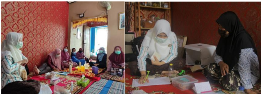
Gambar 2. Pengidentifikasian permasalahan

Kegiatan dilakukan pada 05 Desember 2020 jam 09.00-13.00, pembukaan dan pengidentifikasian permasalahan yang dihadapi mitra ini diawali oleh Ketua Tim Abdimas dan pengurus serta anggota karang taruna Desa Keboan Anom sebagaimana yang ditunjukkan pada Gambar 2.