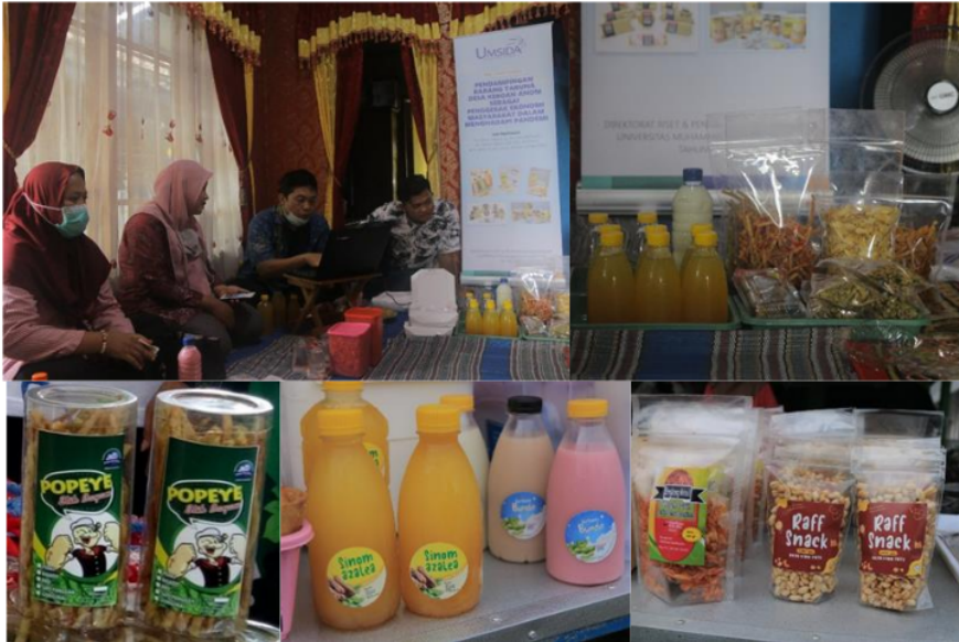
Gambar 3. Hasil kegiatan pelatihan branding produk

Pelatihan dilakukan dengan klinik branding masing-masing produk. Tim abdimas review apa yang menjadi kekurangan produk tersebut. Hasil dari klinik ini, tim abdimas membantu mendesignkan logo produk mitra dan memberikan masukan agar kemasan lebih menarik. Produk - produk karang taruna seperti stik bayam, kripik gayam, sinom dan sari kedelai telah di- branding . Dengan telah branding produk tersebut telah memunculkan kharakteristik tersendiri bagi produk-produk karang taruna Desa Keboan Anom sebagaimana yang ditunjukkan pada Gambar 3.