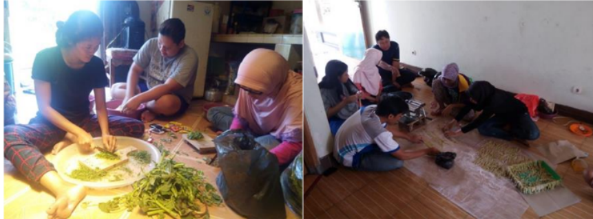
Gambar 1. Kegiatan karang taruna Desa Keboan Anom memproduksi produk olahan hasil pangan

Di Desa Keboan Anom, Kecamatan Gedangan Kabupaten Sidoarjo merupakan salah satu desa mitra UMSIDA. Di desa tersebut terdapat karang taruna yang aktif melakukan kegiatan untuk menanam sayur dan buah. Sayur dan buah yang mereka tanam seperti kangkung, bayam, tomat, cabe, belimbing dan pepaya sebagaimana yang ditunjukkan pada Gambar 1. Hasil panen dari tanaman tersebut mereka olah mejadi produk yang memiliki nilai ekonomis seperti stik bayam, Abon cabe, keripik gayam, sinom, susu kedelai dan aneka produk lainnya (Hanun et al., 2020).