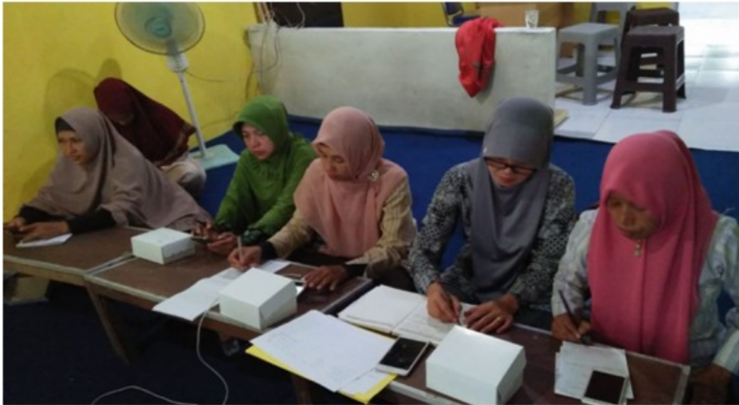
FIGURE 4 | Peserta serius mencatat tips dan langkah membedakan hadis shohih dan palsu