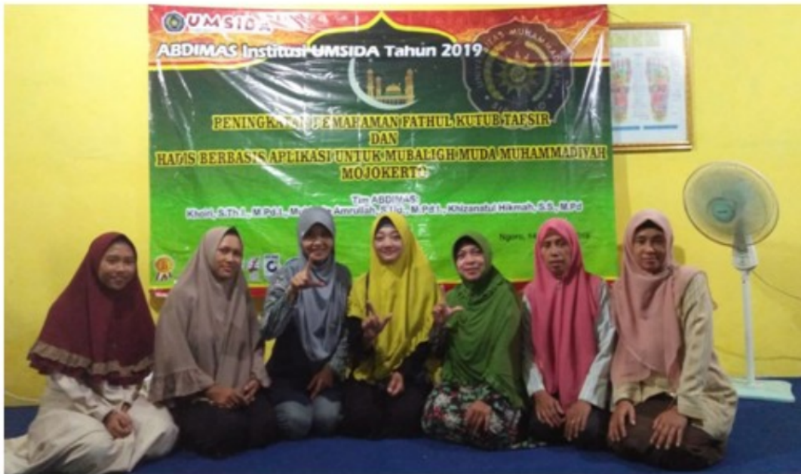
FIGURE 8 | Foto bersama selepas kegiatan pelatihan retorika dakwah