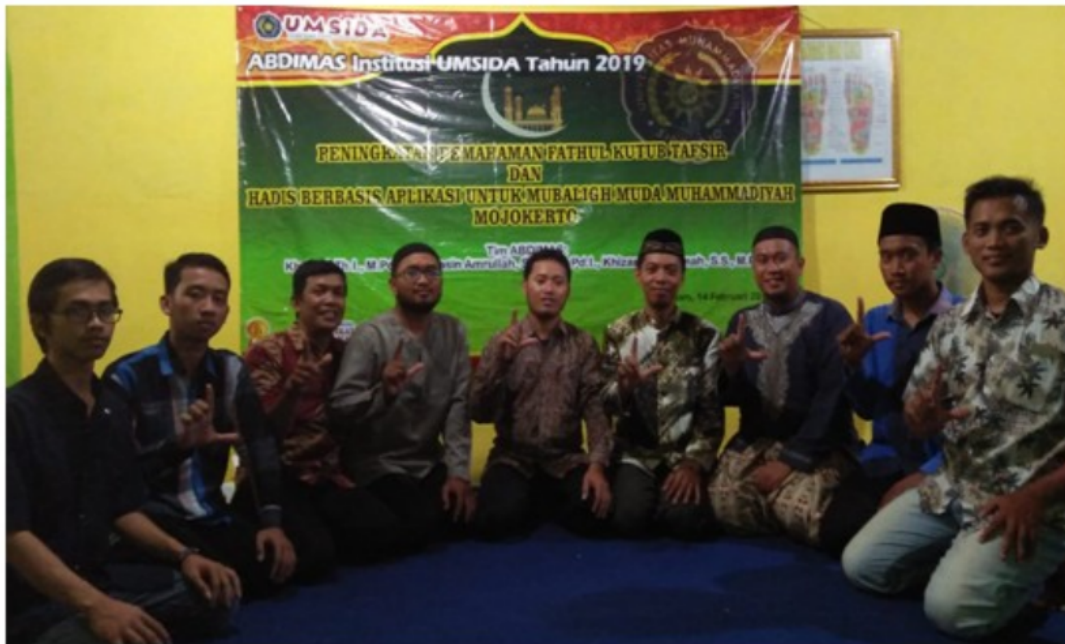
FIGURE 7 | Foto bersama selepas kegiatan pelatihan retorika dakwah