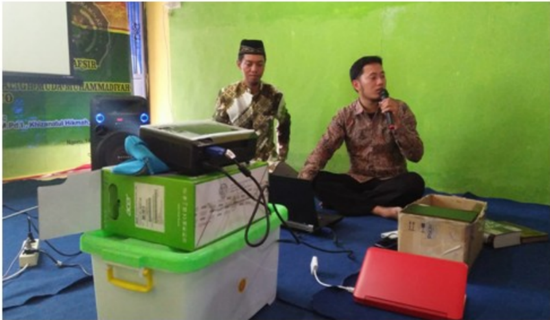
FIGURE 5 | Peserta serius mencatat tips dan langkah membedakan hadis shohih dan palsu