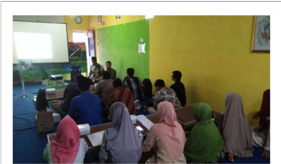
FIGURE 6 | Penjelasan langkah-langkah pemanfaatan media web dan aplikasi dalam merujuk data hadis dan tafsir