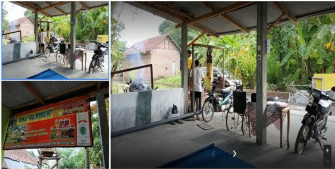
FIGURE 2 | lokasi Mitra Rumah Belajar Al Khoir