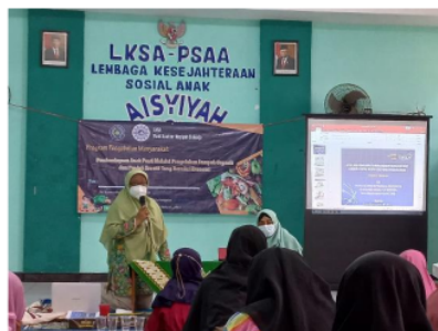
Gambar 1. Sambutan Ketua Tim Abdimas

didaur ulang menjadi sesuatu yang baru dan bermanfaat. Misalnya botol dan gelas plastik, botol kaca, kertas bekas, karton, kaleng bekas, kantong kresek, dan lain-lain menjadi benda-benda kerajinan yang bernilai ekonomis. Membuang sampah sesuai warna-warna pada tempat sampah terbagi menjadi 5, yakni Biru, Hijau, Merah, Kuning, Abu-abu ini disesuaikan dengan hierarki pemanfaatannya sampah. Warna tempat sampah Hijau berarti sampah organik (daun, sisa makanan, ranting), Kuning seperti sampah guna ulang (plastik, kaca, kaleng) lampu, aki, obat nyamuk), Merah seperti sampah B3/Bahan Berbahaya dan Beracun (baterai, Alat medis), Biru untuk sampah daur ulang (kertas, kardus, koran), Abu-abu untuk sampah residu (puntung rokok, popok, tisu, kapas). Selanjutnya anak-anak panti diberikan simulasi membuang sampah sesuai warna tempat sampah ini.