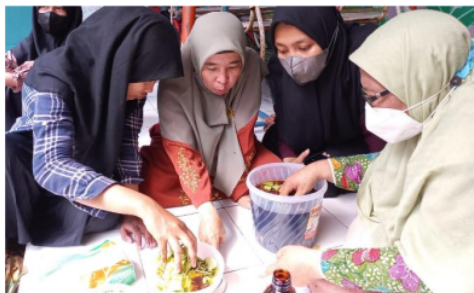
Gambar 6. Menimbang dan Memasukkan Sampah Organik Ke Wadah