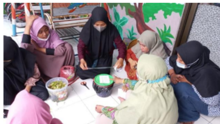
Gambar 8. Labeling Tanggal Pembuatan dan Panen, Komposisi Sampah Organik

Diakhir kegiatan ini diberikan sampel cairan eco enzyme ke panti asuhan agar dicoba memanfaatkan kegunaannya sebelum masa panen. Fermentasi selama 90 hari, pembuatan pada Tanggal 25 maret 2022 maka panen 25 Juni 2022. Saat panen diukur kadar PH dari hasil cairan eco enzyme untuk mengetahui kualitas eco enzyme. Eco enzyme yang baik PH < 4 dan bau segar fermentasi. Tim Abdimas akan memonitoring sampai saat panen nanti. Selama sosialisasi dan pelatihan anak-anak panti sangat antusias dalam mengetahui cara membuang sampah dengan benar, cara memilah sampah dan pelatihan pembuatan eco enzyme, hal ini ditunjukkan dengan beberapa pertanyaan yang diajukan saat kegiatan. Demikian juga ada beberapa pertanyaan dari ibu-ibu pengurus panti, ibu-ibu pengasuh dan pengurus panti ini yang selanjutnya bertanggungjawab dalam mendampingi dan mengarahkan anak panti dalam pemilahan dan pengolahan sampah organik.