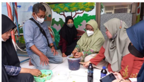
Gambar 7. Proses Semua Bahan Sudah Tercampur Dalam Wadah

Diakhir kegiatan ini diberikan sampel cairan eco enzyme ke panti asuhan agar dicoba memanfaatkan kegunaannya sebelum masa panen. Fermentasi selama 90 hari, pembuatan pada Tanggal 25 maret 2022 maka panen 25 Juni 2022. Saat panen diukur kadar PH dari hasil cairan eco enzyme untuk mengetahui kualitas eco enzyme. Eco enzyme yang baik PH < 4 dan bau segar fermentasi. Tim Abdimas akan memonitoring sampai saat panen nanti. Selama sosialisasi dan pelatihan anak-anak panti sangat antusias dalam mengetahui cara membuang sampah dengan benar, cara memilah sampah dan pelatihan pembuatan eco enzyme, hal ini ditunjukkan dengan beberapa pertanyaan yang diajukan saat kegiatan. Demikian juga ada beberapa pertanyaan dari ibu-ibu pengurus panti, ibu-ibu pengasuh dan pengurus panti ini yang selanjutnya bertanggungjawab dalam mendampingi dan mengarahkan anak panti dalam pemilahan dan pengolahan sampah organik.