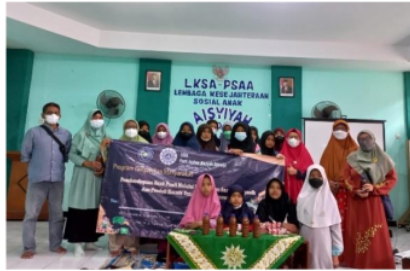
Gambar 9. Foto Bersama Semua Peserta