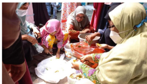
Gambar 5. Memotong dan Mencuci Sampah Organik

Dalam pemaparan materi dijelaskan juga manfaat eco enzyme fisik yakni yang pertama tentunya mengurangi sampah organik dari dapur rumah tangga, meningkatkan kualitas udara dan tanah, menjernihkan air, merawat luka, mengurangi radiasi gelombang elektromagnetik, kebutuhan rumah tangga, dan membersihkan pestisida dan residu pupuk pada sayur. Selanjutnya langsung praktek membuat eco enzyme, membagi empat kelompok dari seluruh peserta pelatihan. Dalam pelatihan ini yang utama sudah disediakan sampah organik oleh panti asuhan, bahan lainnya disediakan oleh Tim Abdimas Umsida antara lain: timbangan, molase, wadah, plastik dan tali. Praktek pengolahan sampah organik menjadi eco enzyme ini diawali semua sampah organik (kulit buah dan sayur) di cuci bersih, bahan sampah organik dalam pelatihan ini kulit nanas, pisang, manisa, jambu, jeruk, kulit wortel, kangkung. Semua bahan sampah organik yang selesai dicuci ditiriskan, baru ditimbang sesuai dengan rumus dan kapasitas wadah fermentasinya.