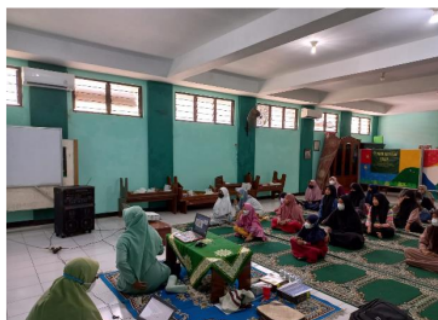
Gambar 3. Simulasi Membuang Sampah Sesuai Warna Tempat Sampah

Selanjutnya kegiatan pelatihan pembuatan eco enzyme, yang merupakan pengolahan sampah organik dapur terdiri dari kulit buah dan sayur segar yang dilakukan fermentasi selama 90 hari dengan fermentasi anaerob (kedap udara). Kegiatan ini diawali pemaparan materi menjelaskan pentingnya menjadi lingkungan untuk kesejahteraan hidup manusia dan makhluk hidup lainnya sesuai pada Alqur'an Ar-Rum ayat 41 yakni "Telah tampak kerusakan di darat dan di laut disebabkan karena perbuatan tangan manusia; Allah menghendaki agar mereka merasakan sebagian dari (akibat) perbuatan mereka, agar mereka kembali (ke jalan yang